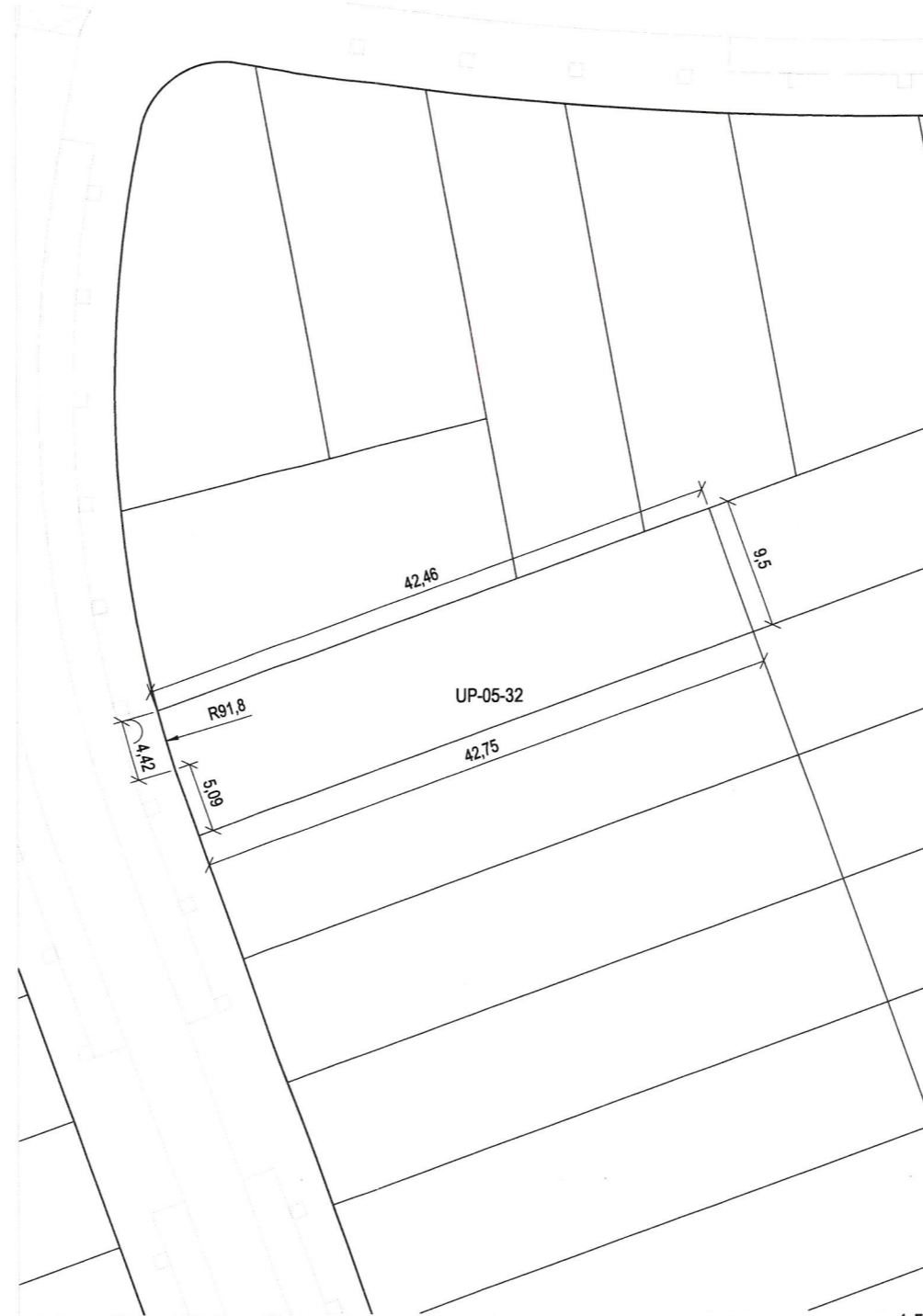
Plano de definición de la parcela