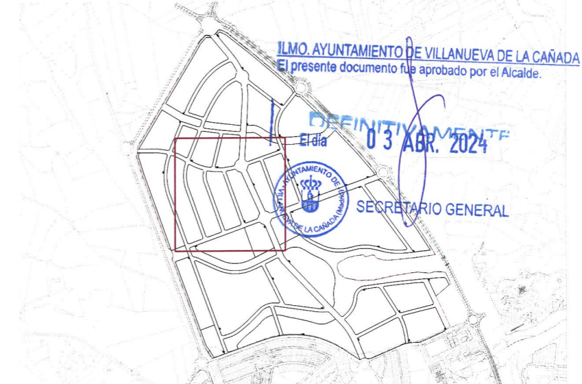
Plano de situación