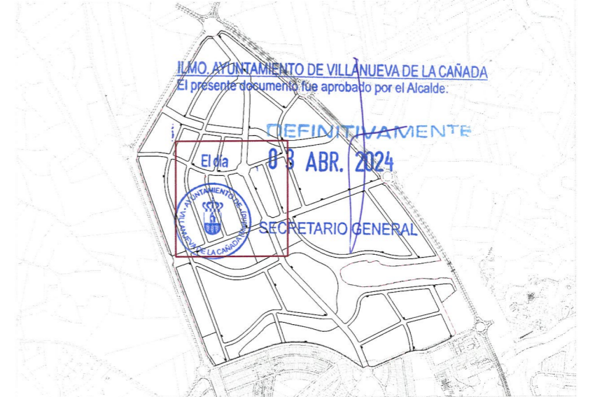
Plano de situación