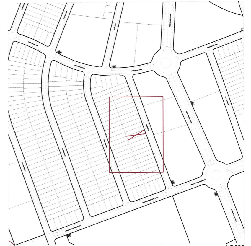
Plano de emplazamiento