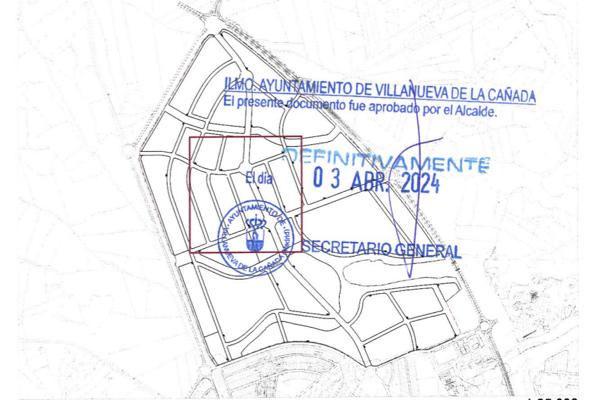
Plano de situación