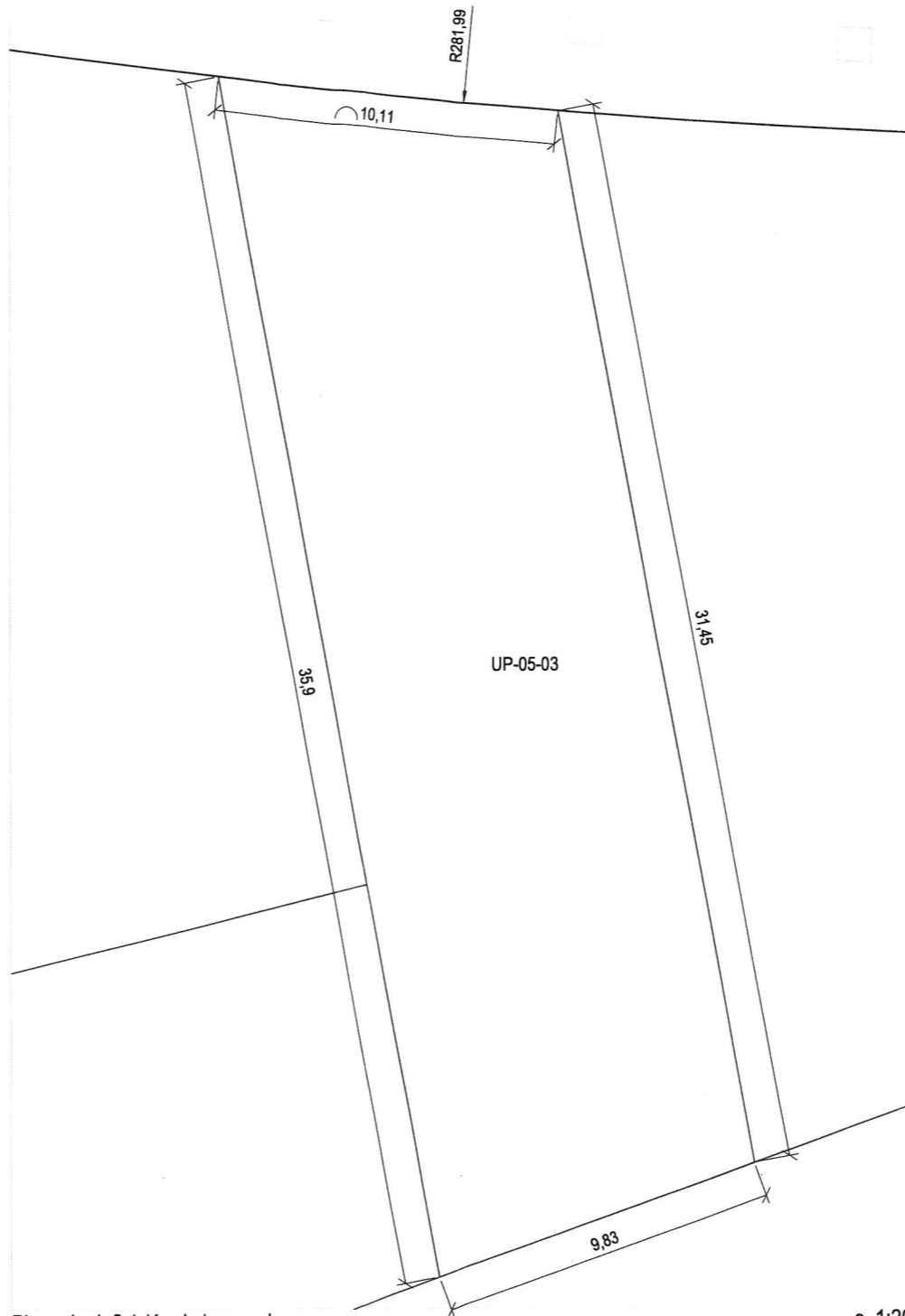
Plano de definición de la parcela