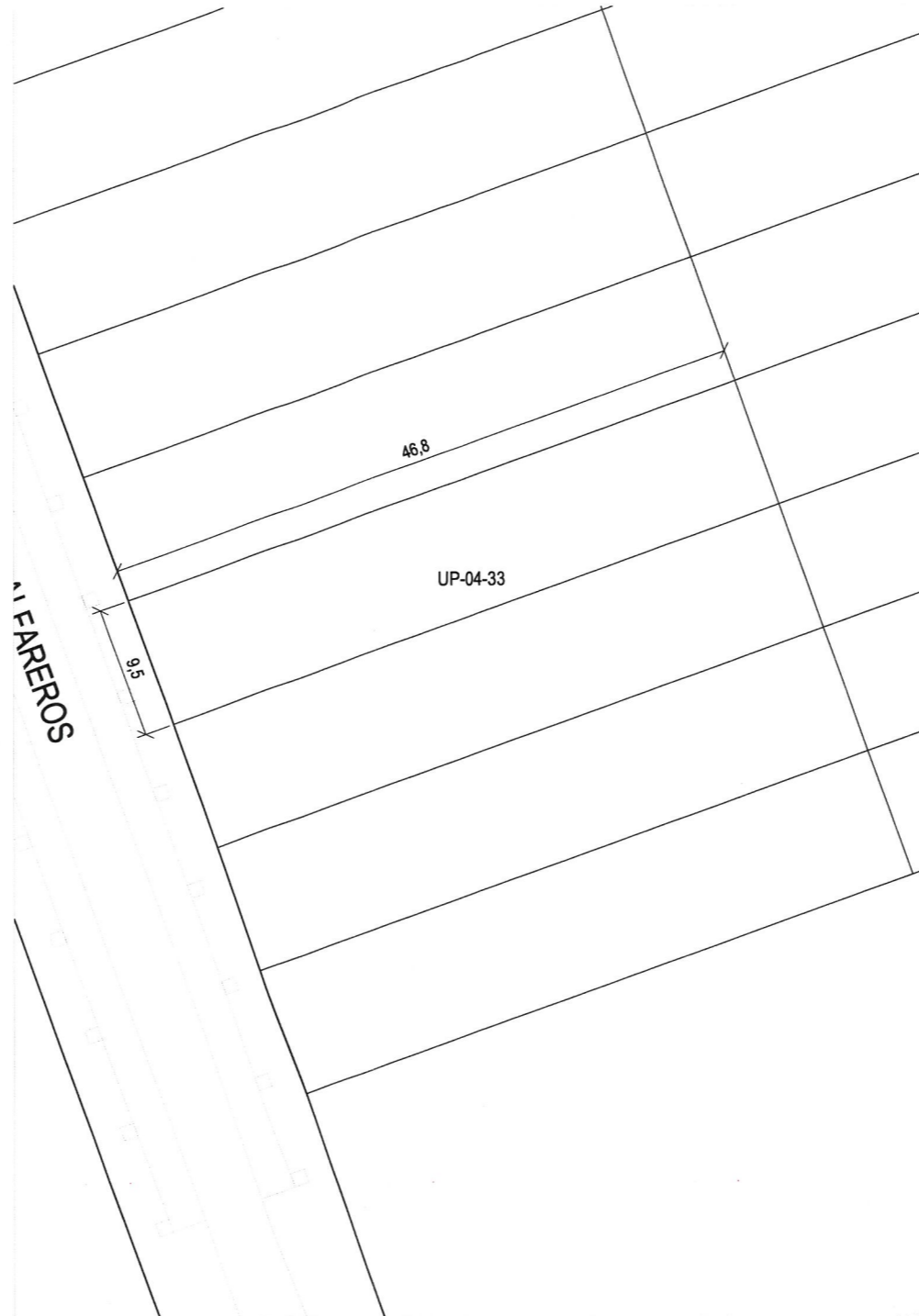
Plano de definición de la parcela