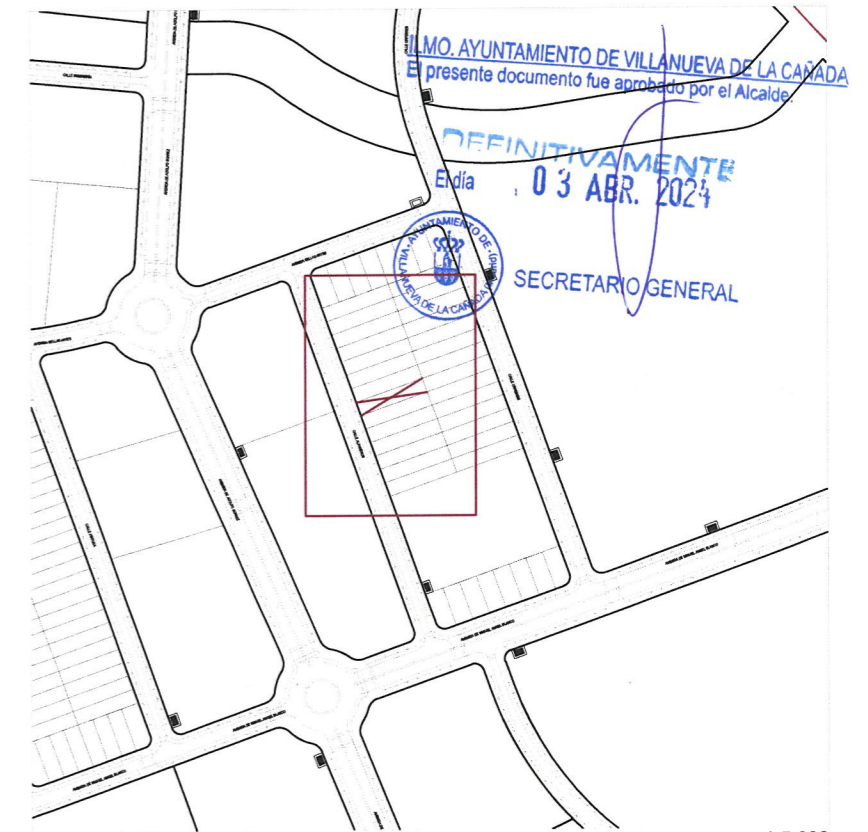
Plano de emplazamiento