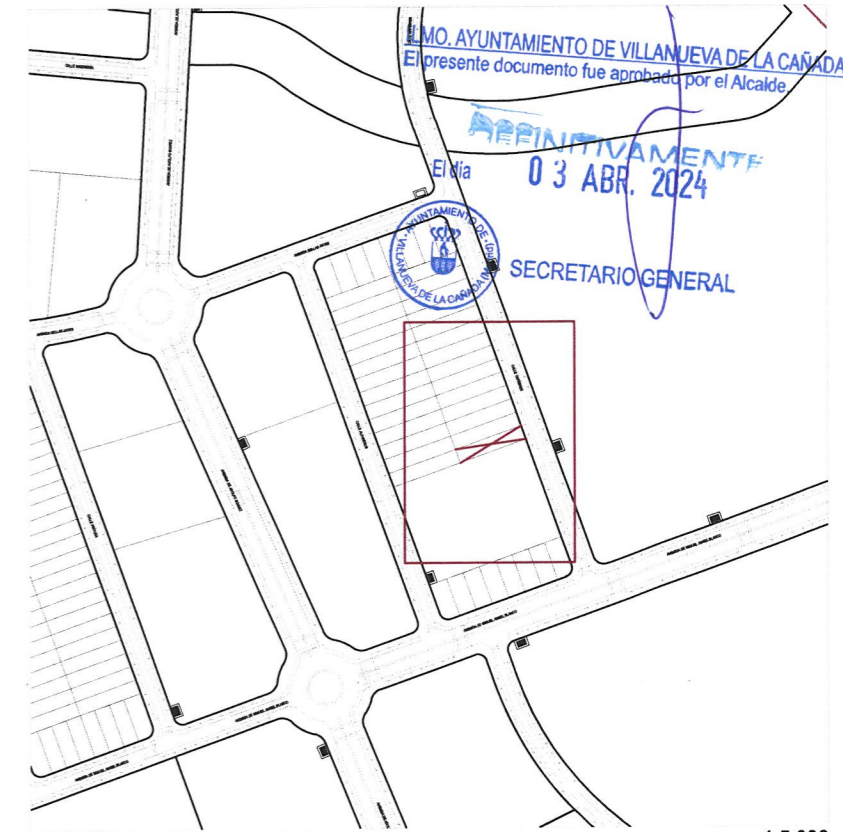
Plano de emplazamiento e. 1:5.000