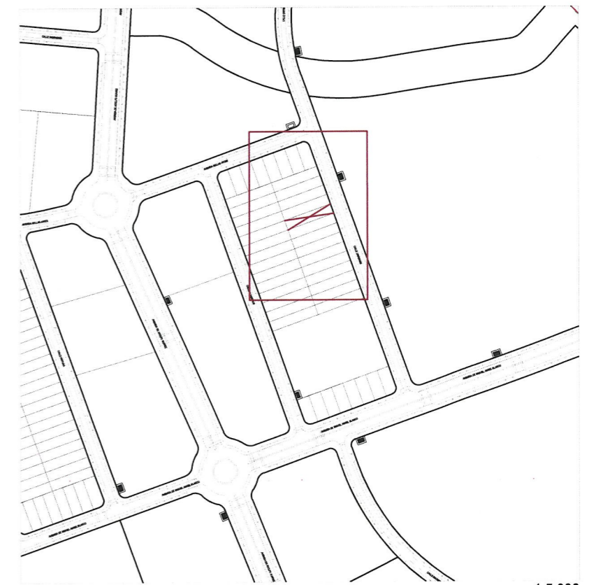
Plano de emplazamiento