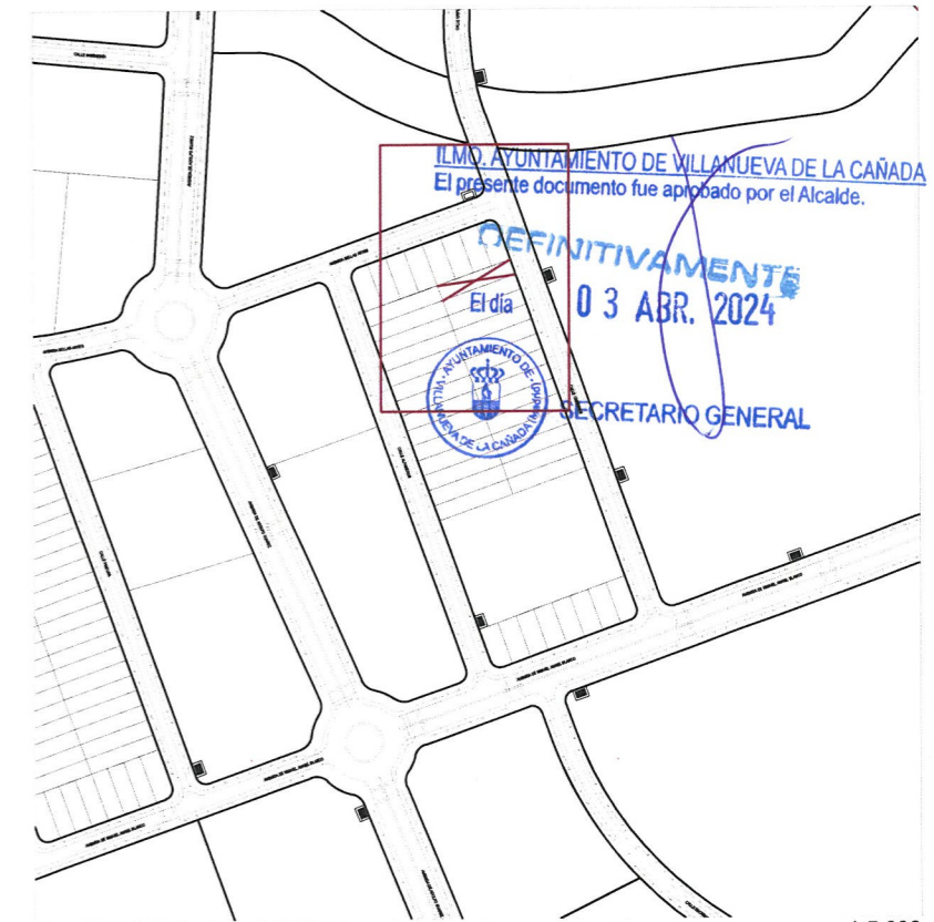
Plano de emplazamiento