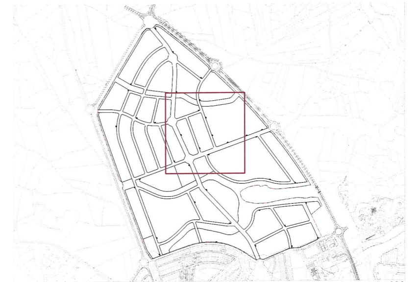
Plano de situación