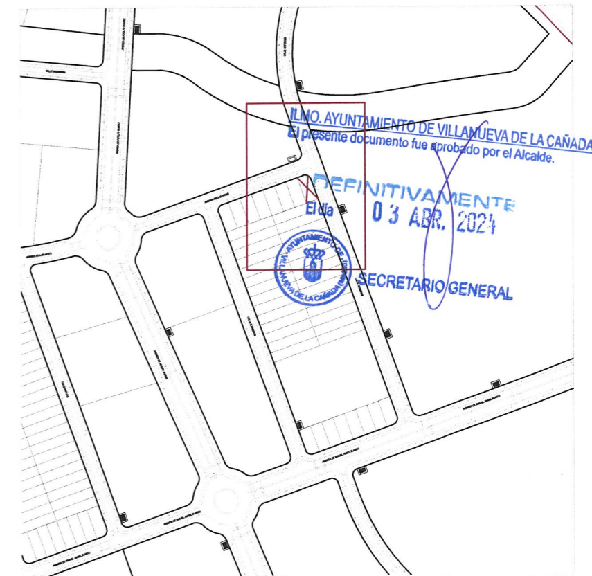
Plano de emplazamiento