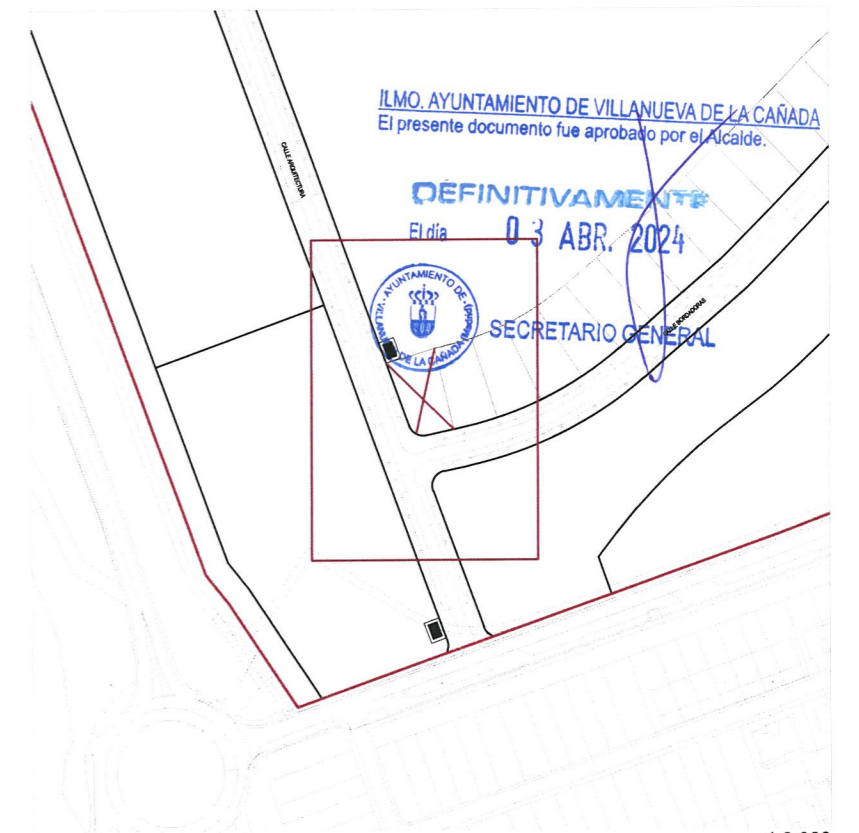
e. 1:250 Plano de emplazamiento