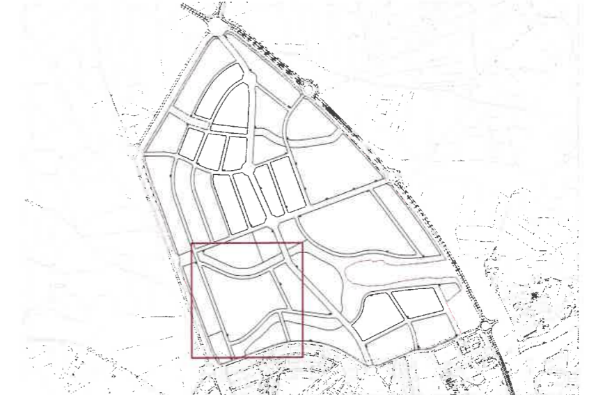
Plano de situación