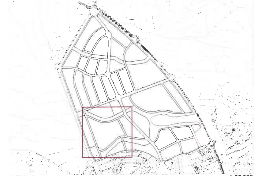
Plano de situación