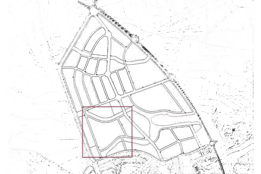
Plano de situación