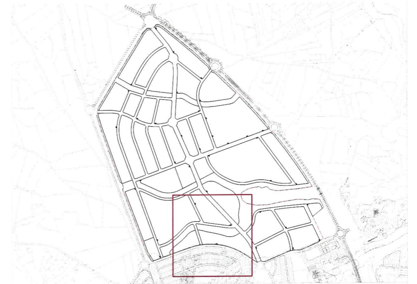
Plano de situación e. 1:25.000