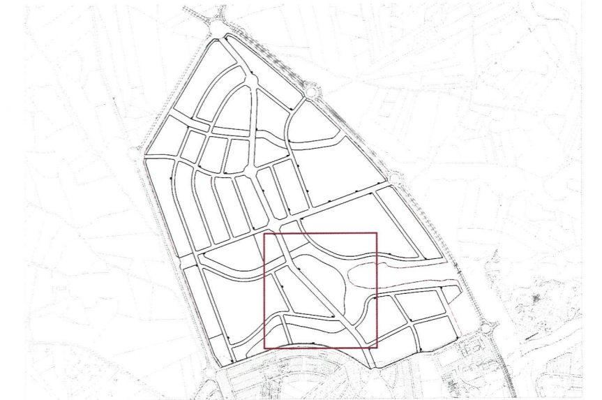
Plano de situación