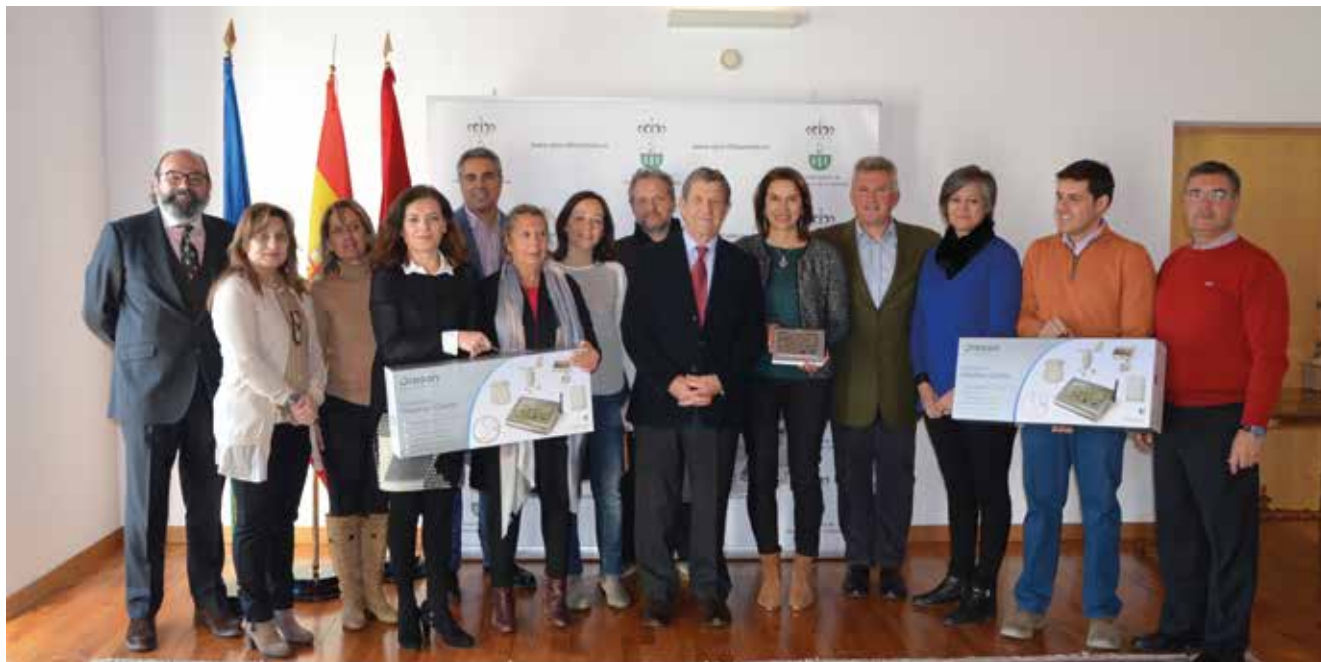
▲ Autoridades municipales junto a responsables del Liceo Molière, Colegio Arcadia, Colegio Internacional Kolbe y Escuela Infantil Municipal Los Cedros.

E l Ayuntamiento ha entregado una estación meteorológica profesional a los responsables del Liceo Molière, Colegio Arcadia, Colegio Internacional Kolbe y Escuela Infantil Municipal Los Cedros. La iniciativa, en el marco del Programa Municipal de Promoción de Huertos Escolares, tiene como finalidad que dichos centros puedan obtener información sobre el clima del municipio. Además de estas cuatro estaciones meteorológicas, el Ayuntamiento va a instalar otra más en dependencias municipales. Este tipo de aparatos proporciona, entre otros datos, información sobre la temperatura, grado de humedad, presión barométrica, el índice UV, la