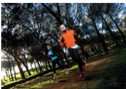
▲ Du Cross Series.