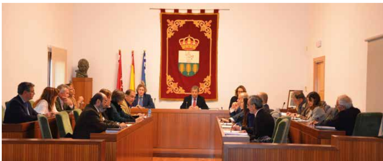
▲ Imagen de la sesión plenaria donde se aprobó el pliego, celebrada el pasado 19 de enero.

Basuras, Limpieza Viaria y eliminación de Residuos Sólidos Urbanos. El Ayuntamiento convocará en breve un concurso abierto para que las empresas puedan presentar sus ofertas una vez haya sido publicado el anuncio en el Diario Oficial de la Unión Europea.