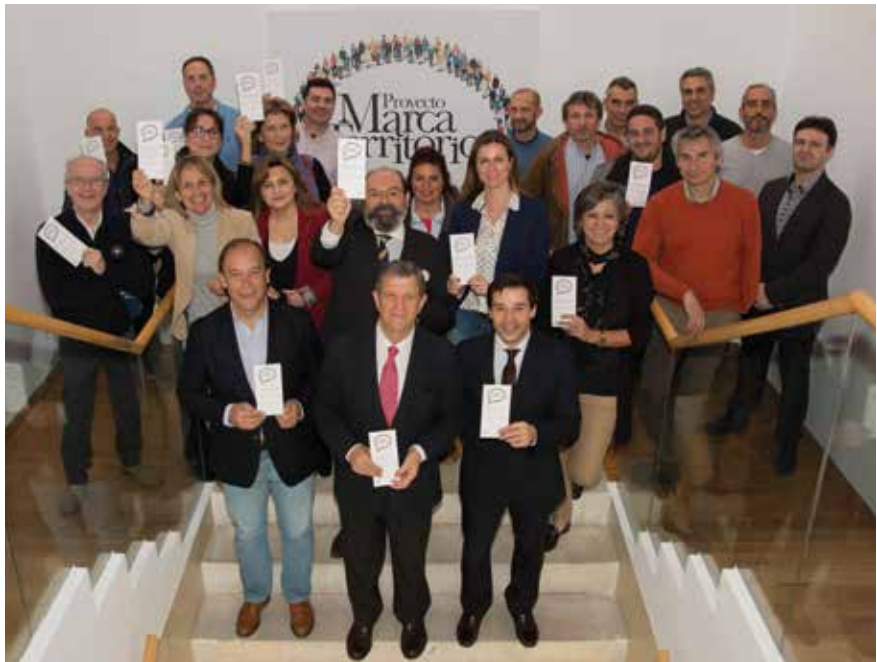
▲ Miembros de la Corporación Municipal junto al representante de EveryonePlus, empleados municipales y miembros de distintos colectivos sociales, culturales y deportivos.

Los vecinos también pueden aportar su visión así como explicar cuáles son para ellos las razones que les llevaron a elegir Villanueva de la Cañada para vivir. Pueden trasladar esa información por escrito o grabar un vídeo con su móvil y enviarlo a