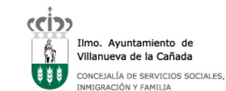
Ilmo. Ayuntamiento de Villanueva de la Cañada CONCEJALÍA DE SERVICIOS SOCIALES, INMIGRACIÓN Y FAMILIA