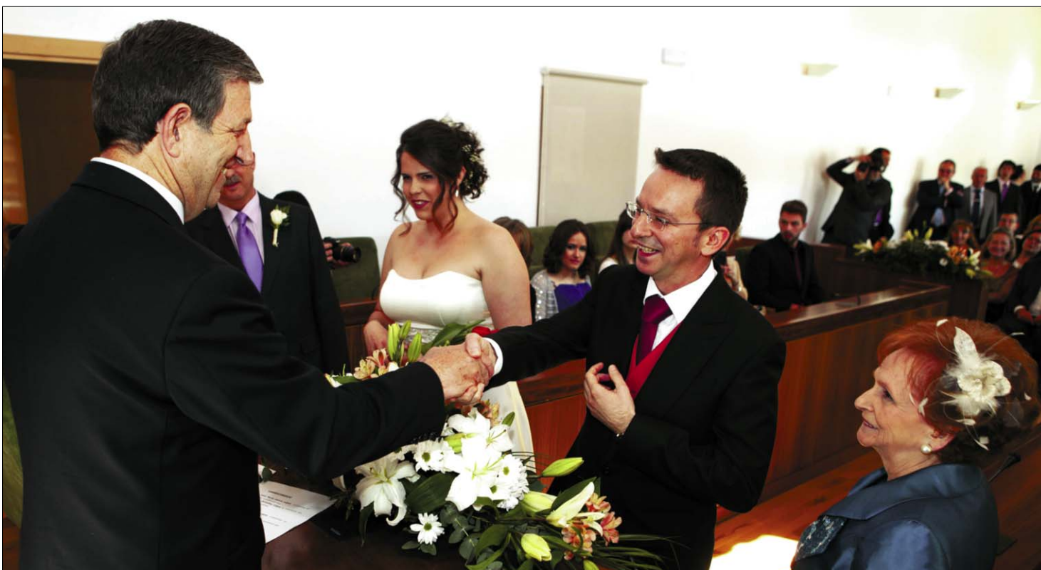
El alcalde oficiando una boda en el Salón de Plenos

Las bodas civiles celebradas en el Ayuntamiento, oficiadas por el alcalde y los concejales de la Corporación Municipal, han aumentado en los últimos tres años. En el año 2003, 12 parejas eligieron esta opción. Desde esa fecha hasta 2010, la media de enlaces celebrados era de una decena al año, una cifra que desde 2011 no ha parado de crecer tanto es así que, en dicho año, se celebraron 19 enlaces y en 2012 fueron 56. Desde enero hasta ahora, el número de bodas celebradas ya supera la treintena. En la mayoría de los casos, los contrayentes no son vecinos del municipio.