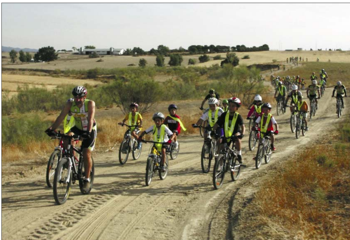
Participantes en una de las pruebas de la Fiesta de la Bicicleta

Vecinos de todas las edades se dieron cita un año más en la Fiesta de la Bicicleta que organiza, desde hace más de dos décadas, el Ayuntamiento con el fin de fomentar la práctica del deporte y el uso de la bici como medio de transporte en el municipio. El encuentro deportivo que arrancó con un paseo rural y un paseo urbano, el pasado 15 de septiembre, finalizó con la prueba de Mountain-Bike este pasado sábado, 21 de septiembre. En total, más de 700 vecinos participaron en esta edición en la que colaboraron los clubes de Triatlón y Baloncesto del municipio así como empresas locales y de la zona como la ITV de Majadahonda.