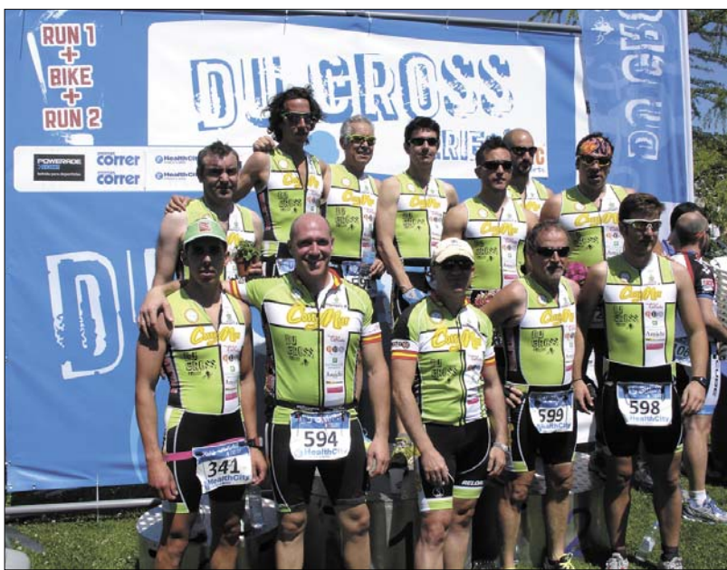
Foto de grupo del Club de Triatlón tras participar en el Du Cross Series

También han participado en eventos fuera de la Comunidad entre los que cabe destacar la III Bike Maratón Montes del Sella-Ribadesella-Cantabria y el Open Mountain Bike Quismondo Toledo.