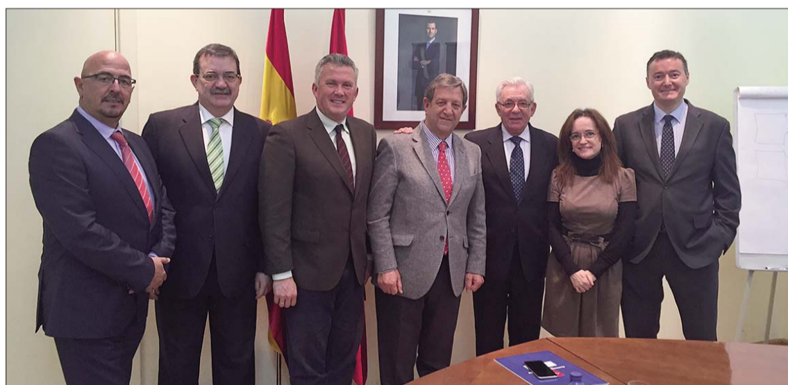
Reunión en la sede de la Consejería de de Sanidad de la Comunidad de Madrid

“Son unas mejoras necesarias que, sin duda, van a redundar en la calidad del servicio prestado en nuestro centro de salud”, explicó el regidor. Las obras, con un presu-