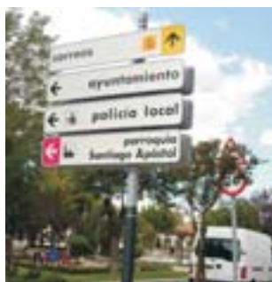
El Taller de Ricardo Bofill, encargado del diseño.

El Ayuntamiento ha instalado ya los nuevos paneles de señalización direccional de todos los espacios de interés, ubicados en el centro urbano. La empresa adjudicataria del proyecto es Signature Señalización S.A y el Taller de Arquitectura de Ricardo Bofill ha sido el encargado del diseño de los citados elementos del mobiliario urbano. Éstos se caracterizan por: un diseño moderno y depurado, la durabilidad y fácil mantenimiento, la calidad plástica y constructiva así como por su perfecta integración en la trama urbana.