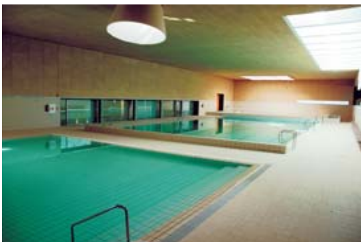
El complejo deportivo cuenta con tres vasos para la práctica de la natación.

Cada vaso tiene un fin específico: para la práctica de la natación -en el que se pueden celebrar competiciones a nivel local, autonómico e incluso nacional (competiciones en piscina corta)-, para la enseñanza y por último, el citado vaso de saltos con dos trampolines, en el que también se pueden desarrollar el mismo tipo de competiciones.