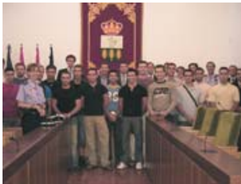
Los futuros agentes durante su toma de posesión como funcionarios en prácticas.

Este incremento en el número de efectivos se enmarca dentro del Proyecto de Seguridad de la Comunidad de Madrid, impulsado por el Ejecutivo Regional con la colaboración de la Federación de Municipios de Madrid que preside el regidor villanovense. Su incorporación duplicará la actual plantilla, compuesta por 23 agentes.