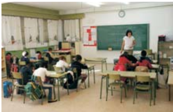
La enseñanza de la lengua inglesa, objetivo prioritario en los centros educativos públicos.

Villanueva de la Cañada inicia el curso escolar con dos novedades: aumenta el número de alumnos escolarizados en centros educativos sostenidos con fondos públicos y el C.E.I.P. "Santiago Apóstol" pasa a formar parte del "Plan de Centros Educativos Bilingües", impulsado por la Consejería de Educación de la Comunidad de Madrid.