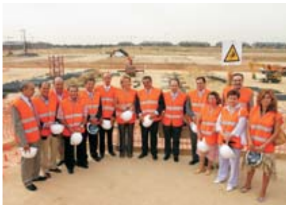
La presidenta, Esperanza Aguirre, visitó las obras acompañada por los alcaldes de los municipios del Área 6.

Está previsto que las obras de construcción concluyan a finales de 2007. El hospital, con una superficie construida de 160.000 m 2 , dispondrá de unidades de Cirugía, Pediatría, Medicina Interna, Urgencias, Rehabilitación, Cardiología y Gastroenterología. En el bloque quirúrgico, se ubicarán Urología, Traumatología, Otorrinolaringología, Oftalmolo-