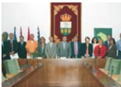
El objetivo, mejorar la calidad de vida de los empleados cuando se jubilen.

El Plan de Pensiones es fruto del Acuerdo Convenio entre el consistorio villanovense y la plantilla municipal.