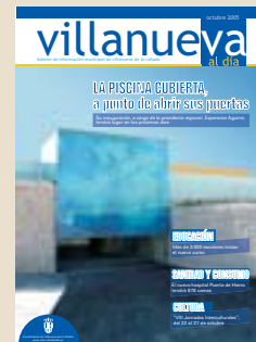
Acceso principal a la piscina cubierta