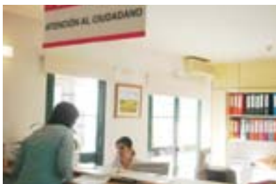
El ciudadano recibirá asesoramiento.