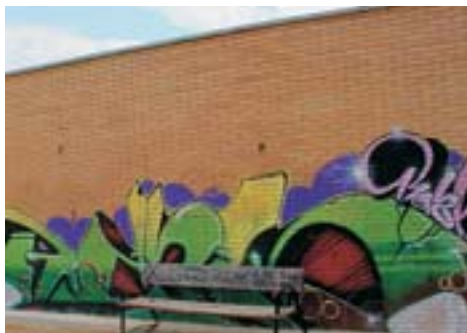
Pared del nuevo Centro de Salud "El Castillo", aún sin inaugurar.

daños causados costará al erario municipal miles de euros.