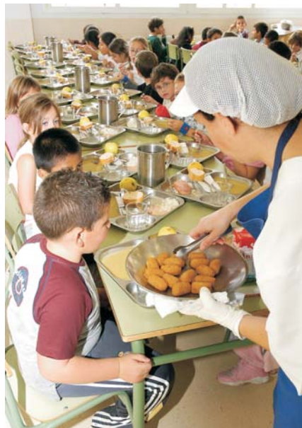
En los comedores de los centros educativos del municipio se sirven menús específicos para alumnos alérgicos al pescado y huevo.

A partir de este curso y hasta 2010, Villanueva de la Cañada va a participar junto con otros 4 municipios españoles -todos ellos pertenecientes a la Red Española de Ciudades Saludables- en el Programa THAO (Think Action Obesity) sobre obesidad