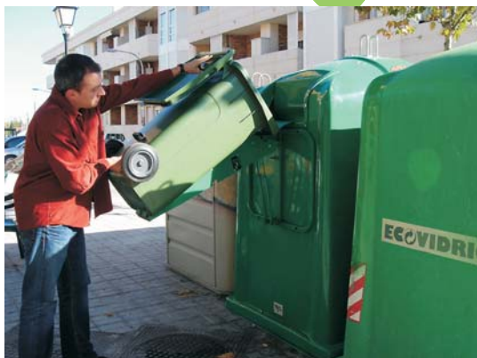
Nuevos contenedores de recogida de vidrio para hosteleros y restaurantes.