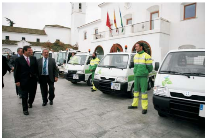
El servicio de recogida de basuras y limpieza viaria dispondrá, a partir de ahora, de más recursos humanos y materiales.

Como todos los años y a través de la "Ventanilla Abierta" (apartado referido a incidencias en parques y jardines), los ciudadanos pueden solicitar la retirada de los abetos naturales con los que decoran sus hogares en Navidad. Los ejemplares serán trasplantados en parques y jardines públicos del municipio. Para ello, es fundamental que los propietarios rieguen el árbol y lo mantengan en su correspondiente maceta hasta que sea retirado por los operarios municipales.