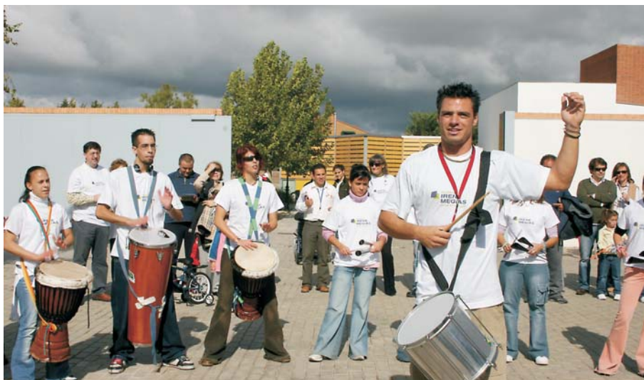
Actuación del Grupo Samba la Nueva.

El Ayuntamiento organizó, del 21 al 27 de octubre, una nueva edición de las Jornadas Interculturales y Solidarias en colaboración con la Mancomunidad de Servicios Sociales La Encina y UNICEF.