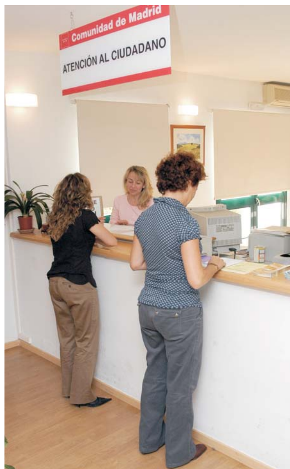
Acercar la Administración al ciudadano, objetivo del servicio.

El horario de atención al público en la Oficina -ubicada en la calle Rosales, nº 1- es de lunes a viernes, de 9:00 a 14:00 horas.