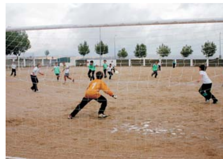
La sustitución de la arena por césped artificial, principal novedad.

Ya se han iniciado las obras de reforma del Campo de Fútbol Municipal y las zonas aledañas. El proyecto contempla, entre otras mejoras, la instalación en el terreno de juego de césped artificial (sintético), dos graderíos cubiertos con capacidad para 500 personas sentadas, aseos, nuevos vestuarios y marcadores electrónicos. Además, se construirán en la misma zona tres pistas de pádel en cristal y nuevos aparcamientos para vehículos.