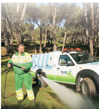
Servicio Urgente de Limpieza.

Una de las principales novedades es la creación del Servicio Urgente de Limpieza (SUL), que será activado ante cualquier incidencia que se pueda producir: accidentes de tráfico, inclemencias meteorológicas, incendios, etc. En este tipo de situaciones, entrará en funcionamiento un vehículo todoterreno equipado con las más modernas tecnologías.