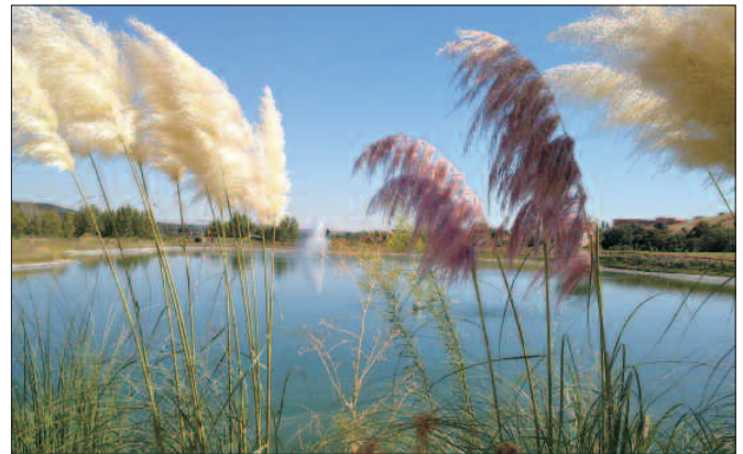
Imagen de la balsa construida especialmente para permitir la puesta en marcha del nuevo sistema de riego.