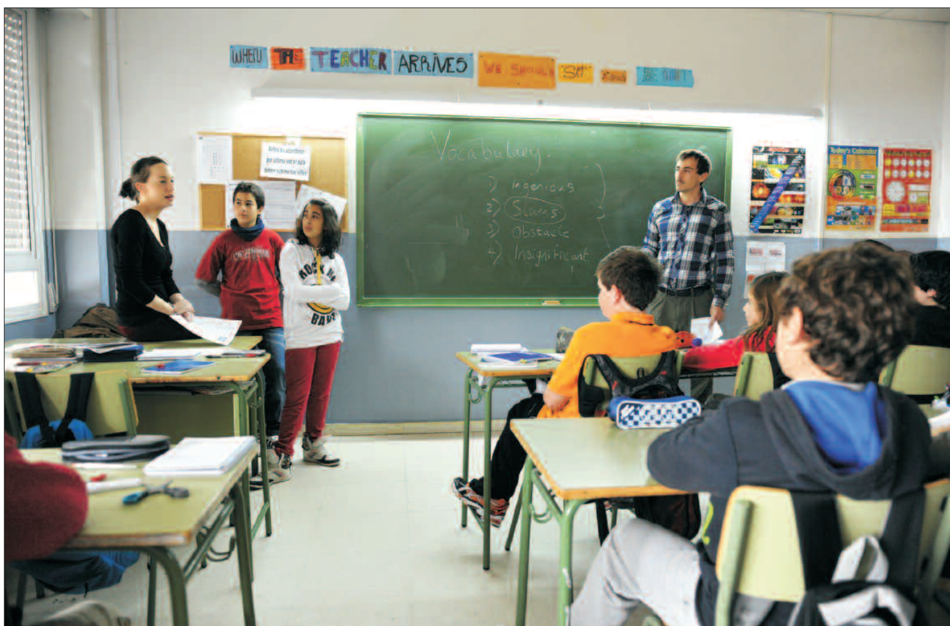
Alumnos del I.E.S. Las Encinas recibiendo una clase en inglés.

Después del éxito obtenido con la Sección Lingüística de Francés, el Instituto de Enseñanza Secundaria Las Encinas ha incorporado a su plan de estudios la enseñanza bilingüe en inglés. Con esta aportación, Las Encinas se convierte en uno de los tres únicos institutos de la Comunidad de Madrid en combinar la educación en dos lenguas.