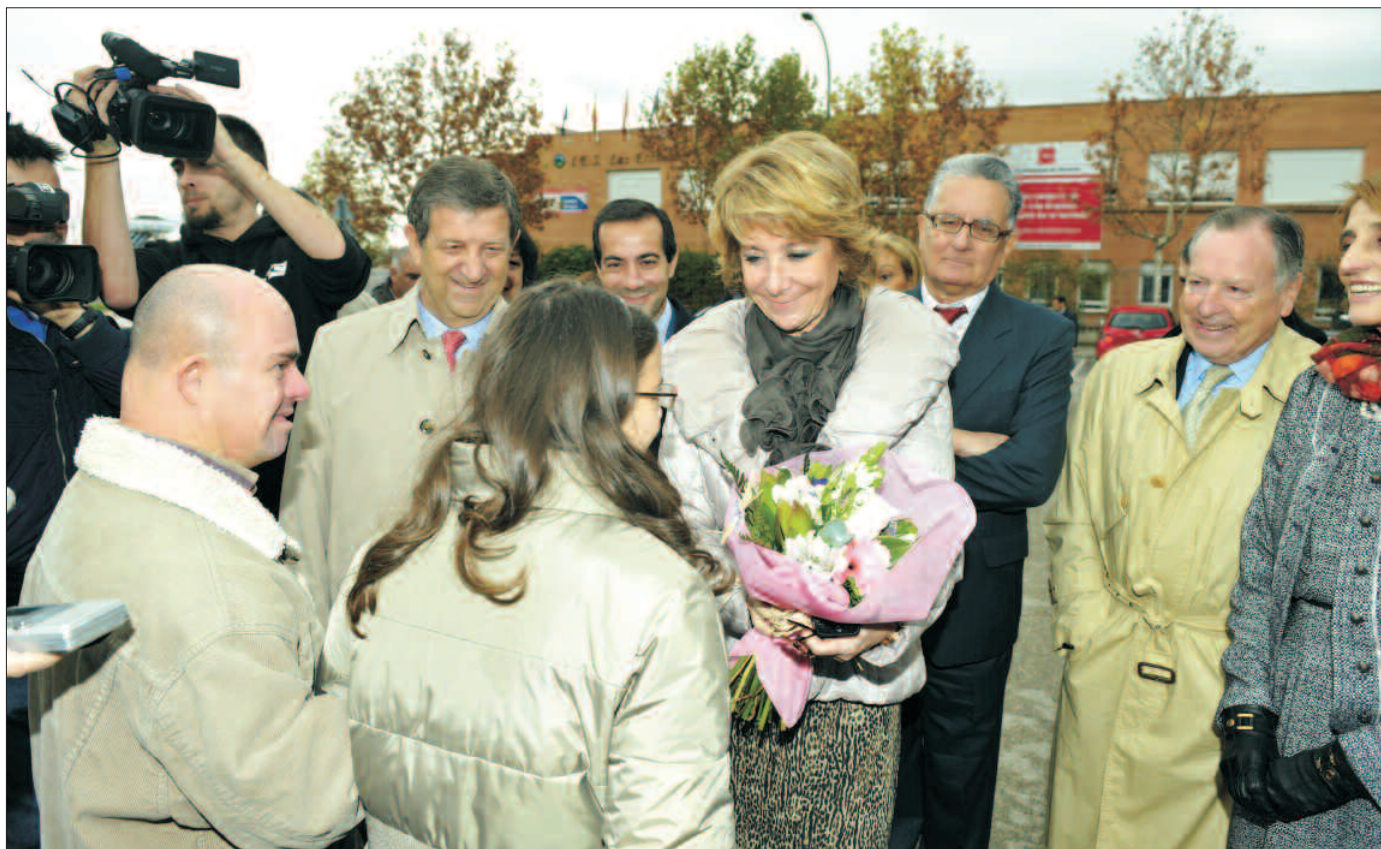
La presidenta regional recibió un ramo de flores a su llegada al centro de la Fundación Jardines de España.