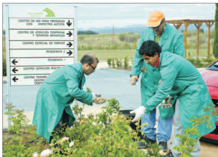
Varias personas discapacitadas de la Fundación, trabajando en las instalaciones del complejo asistencial de Villanueva de la Cañada.

buen uso de los recursos y medios que se fueran consiguiendo. En 1998, Esperanza Aguirre- entonces Ministra de Educación y Cultura- colocaba junto al regidor villanovense, la primera piedra del complejo asistencial que ambos inauguraron en 2004.