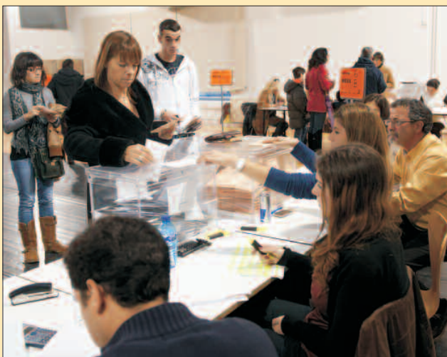
El índice de participación en el municipio fue superior al registrado a nivel nacional.

UN TOTAL DE 8.790 VILLANOVENSES ejercieron su derecho al voto el pasado 20 de noviembre durante las Elecciones Generales, según fuentes del Ministerio del Interior. El Partido