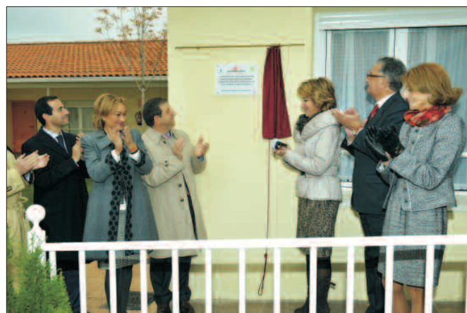
Momento en el que la presidenta de la Comunidad de Madrid descubrió la placa inaugural.

Según fuentes regionales, la Comunidad de Madrid destina casi tres millones de euros al año a financiar las 186 plazas que la Fundación Jardines de España tiene en su centro de la ave-