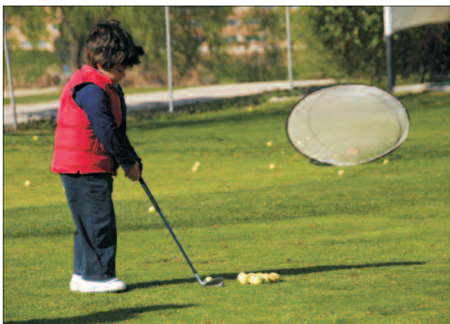
La formación de los más pequeños es uno de los objetivos del Club.

dad para 1.200 socios, haya puesto en marcha este año una campaña de captación de nuevos miembros, dirigida fundamentalmente a las familias. "El objetivo es conseguir que el club sea económicamente sostenible", explica. Por esa razón, se plantean como próximo reto la ampliación del actual campo en 9 hoyos más. "Eso lo cambiaría todo y nos permitiría, sin duda, abrirnos a nuestro municipio aún más y organizar un número mayor de torneos", concluye Eladio Moreira y Vélez.