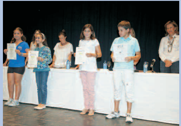
Acto de entrega de diplomas de la Escuela Municipal de Inglés, celebrado en septiembre.

La Escuela Municipal de Inglés ha comenzado el curso escolar 2011-2012 con medio millar de alumnos. Durante el pasado año, el 98% de los estudiantes presentados a examen superaron las distintas pruebas de nivel. El centro es, desde el año 2000, un centro examinador de pleno derecho para la obtención de los títulos otorgados por la prestigiosa Universidad de Cambridge. Por la escuela, además, han pasado y se han examinado con éxito más de 1.200 estudiantes en la última década.