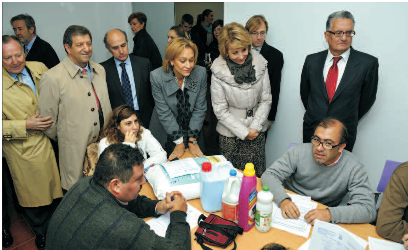
Las autoridades recorrieron las nuevas dependencias del Centro Especial de Empleo.

93 m 2 cada una, tienen capacidad para 48 personas con discapacidad gravemente afectadas.