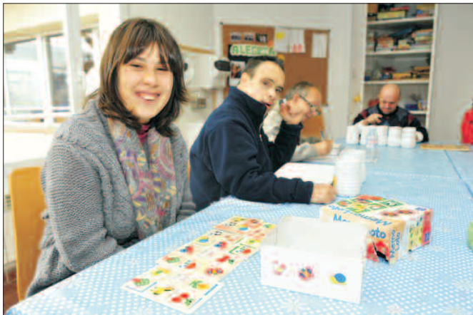
En la Fundación se llevan a cabo actividades destinadas a fomentar las habilidades de las personas con discapacidad.