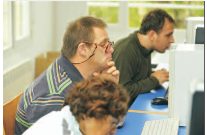
La formación abarca también áreas como la de las nuevas tecnologías.

nida de Burgos, en la capital, y en el complejo asistencial de Villanueva de la Cañada. De éstas, 108 son de centro ocupacional, 32 de residencia con centro ocupacional y 46 de residencia con centro de día.