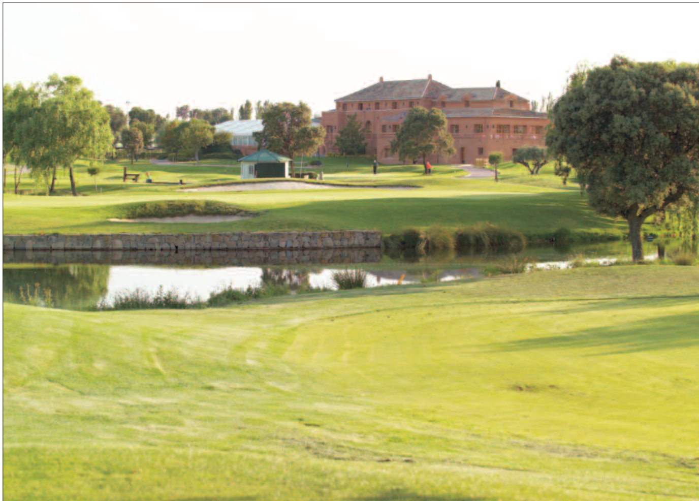
Imagen de las instalaciones del Club de Golf La Dehesa.

El Club de Golf La Dehesa celebra en 2011 su vigésimo aniversario. A lo largo de estas dos décadas, ha ido evolucionando hasta convertirse en un club sostenible desde el punto de vista medioambiental y en todo un referente en el ámbito formativo, tanto es así que cuenta con la segunda escuela de golf más importante de España.