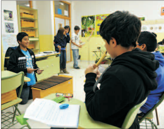
Estudiantes de secundaria en clase de música.