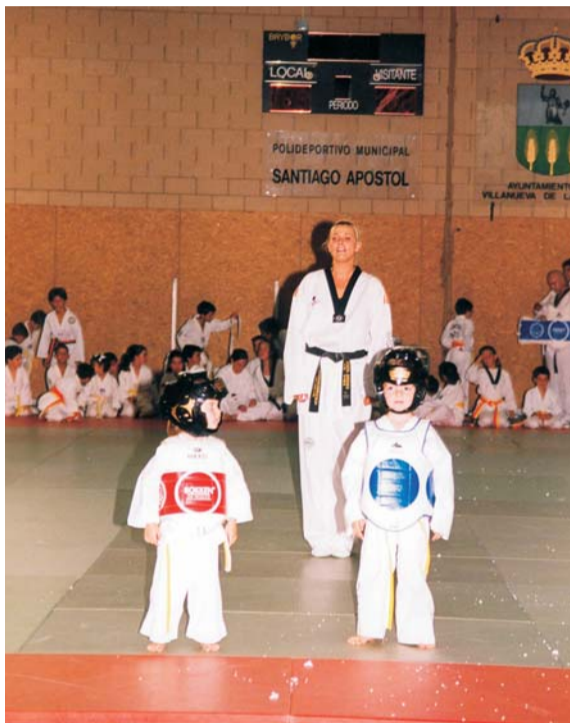
La medallista olímpica, Coral Bistuer, impartirá las clases de taekwondo.

Las actividades se desarrollarán en los gimnasios del Complejo Deportivo (Avda. Mirasierra, nº 4), lugar en el que también se pueden formalizar las inscripciones. El precio de la matrícula, para empadronados, es de 23.50 euros. El importe de la mensualidad, entre 15.50 y 41 euros, está en función de la categoría (infantil o adulto) y la disciplina.