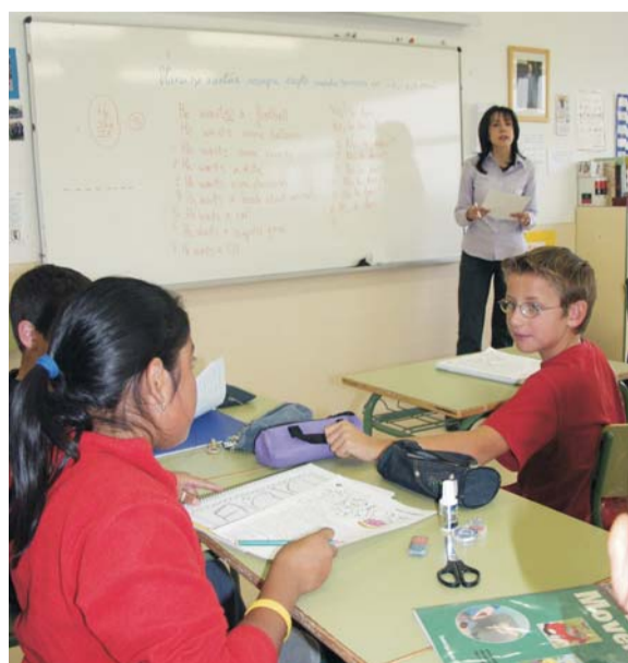
El Ayuntamiento, la CM y las familias financian las actividades.

Las personas interesadas pueden recibir más información sobre los precios e inscripciones en los citados centros educativos.