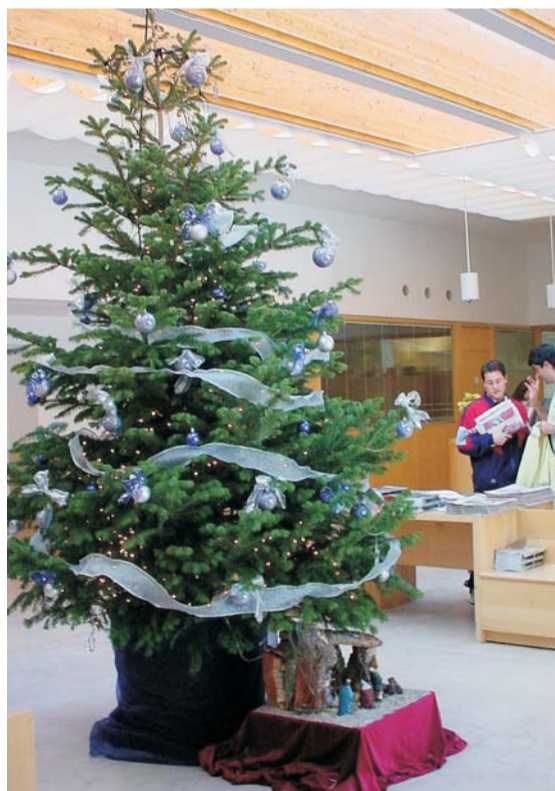
También serán trasplantados los árboles que decoran los centros municipales.

Los ciudadanos podrán solicitar su retirada, a través de la página web municipal y concretamente del Servicio de Ventanilla Abierta, dejando constancia de su solicitud en el apartado referido a las incidencias en parques y jardines o bien llamando al teléfono 91 811 73 00.