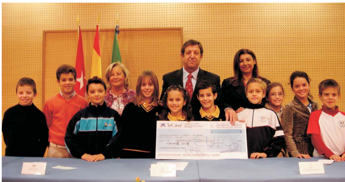
El alcalde agradeció la gran participación ciudadana en las jornadas durante la entrega del cheque a UNICEF.