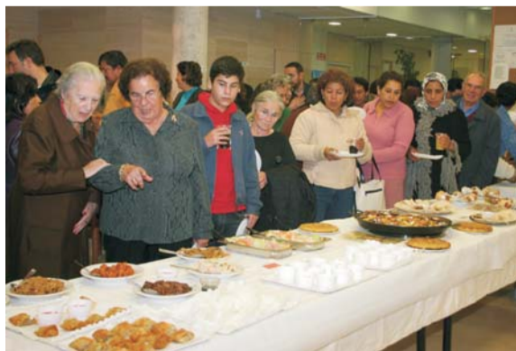
Restauradores y alumnos de la Escuela de Adultos participaron en la elaboración de los platos.

El broche final lo puso el Mercadillo Solidario que, debido a la lluvia, tuvo que celebrarse el 26 de noviembre. Numerosas organizaciones no gubernamentales (Manos Unidas, Ayuda en Acción, Fundación Fabretto, Horizontes Abiertos, Cesal, etc.) y colectivos del municipio, como AMVAR, dieron a conocer su labor y vendieron productos de comercio justo. La asociación Gurdwara Sing Sabha amenizó el encuentro con comida y danzas hindúes.