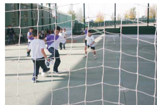
Los alumnos de Educación Física de la UAX arbitraron los partidos.