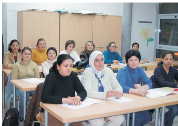
El objetivo, facilitar el acceso de la mujer al mercado laboral.