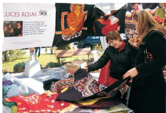
Durante el Mercadillo se pusieron a la venta productos procedentes de distintas partes del mundo.

El dinero se va a destinar al proyecto de UNICEF denominado "Letras para las niñas", que tiene como finalidad evitar la discriminación que las niñas sufren en el país afgano. Según datos de la ONG, durante el pasado curso escolar, de 5.5 millones de niños escolarizados, sólo 1.2 millones eran niñas.