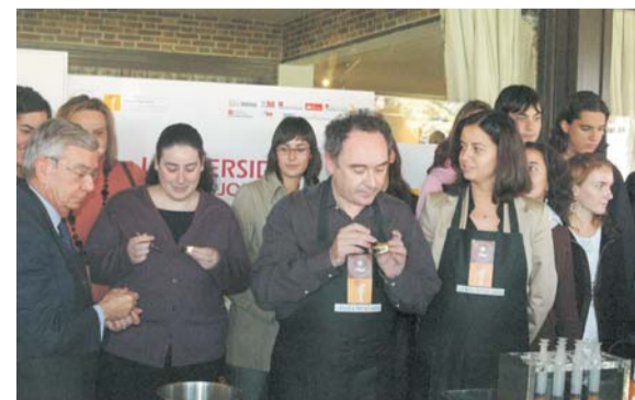
Los alumnos disfrutaron en su primera clase de una demostración de cocina creativa.