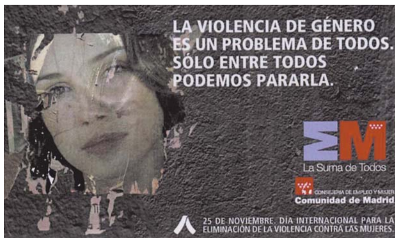
Las campañas de concienciación forman parte de las actuaciones dirigidas a toda la población

Con el fin de informar a los ciudadanos sobre este nuevo recurso, la Mancomunidad ha iniciado una campaña informativa sobre el Punto Municipal del Observatorio Regional de la Violencia de Género que se completa con actividades en los centros educativos, dirigidas a fomentar la igualdad de oportunidades entre hombres y mujeres. Precisamente, el pasado día 24 de noviembre, con motivo del "Día Internacional contra la Violencia hacia las mujeres", el personal del Punto participó en la mesa redonda organizada por la Concejalía de Mujer en el C.Cívico "El Molino", en la que se abordó esta problemática social y se condenó la violencia de género.