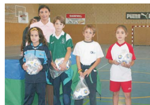
La concejal de Servicios Sociales junto a los representantes de los colegios participantes (Kolbe, Liceo, Zola y Arcadia).