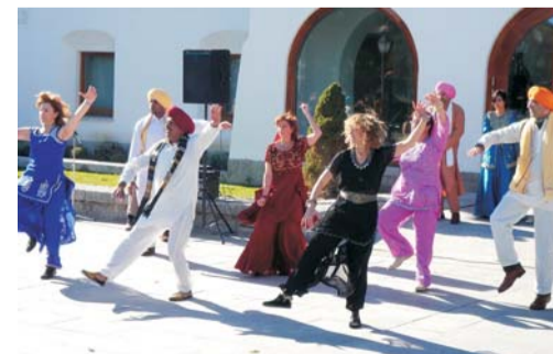
El dinero recaudado en el Mercadillo irá destinado a cooperación.