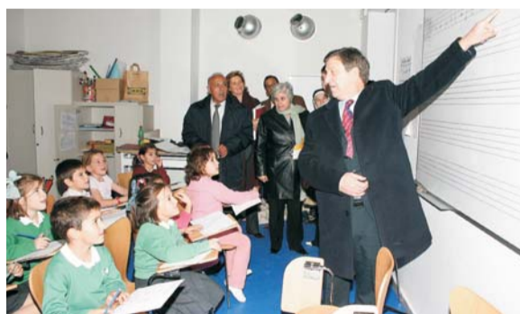
La delegación visitó las principales instalaciones municipales.

El dinero ha ido destinado a la mejora de las instalaciones y compra de material sanitario para una guardería infantil así como al mantenimiento de talleres de artesanía en los que trabajan numerosas mujeres para sacar adelante sus economías domésticas.