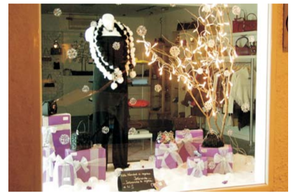
Jacaranda, 1er Premio en 2004.

El 1er premio estará dotado con 475 euros, el 2º con 350 euros y el 3º con 200 euros. Recibirán además un trofeo de la Cámara de Comercio e Industria de Madrid. La entrega, en el C.C "La Despernada", es el 22 de diciembre, a las 20:00 horas.