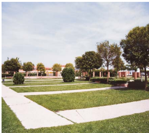
Parque "La Estrella".

En los próximos meses se presentará un primer diagnóstico medioambiental del municipio. Se establecerán las primeras líneas de acción, entre ellas, la puesta en