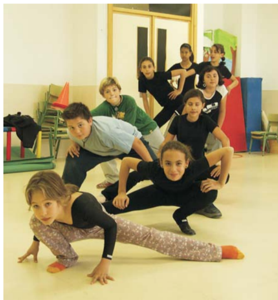
Alumnos del C.E.I.P "María Moliner"

La experiencia -a la que se han sumado durante este primer trimestre un centenar de niños- contempla actividades educativas y lúdicas: apoyo al estudio, danza española, kárate, juegos de ocio, etc.