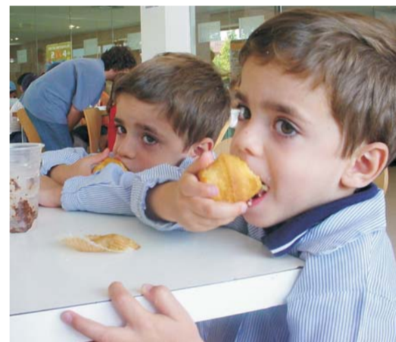
Los escolares, principales beneficiarios.

En este foro estarán representados todos los centros docentes del municipio así como el Ayuntamiento, el Centro de Salud y las Consejerías de Sanidad y Educación a través de sus correspondientes áreas territoriales.