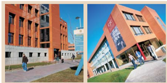
La UAX inició su andadura en el curso 1994-95 y un lustro después, la UCJC.

El libro- del que se han editado un total de 2.800 ejemplares- ha sido financiado por el consistorio y la Dirección General de Urbanismo y Planificación Regional de la Comunidad de Madrid.