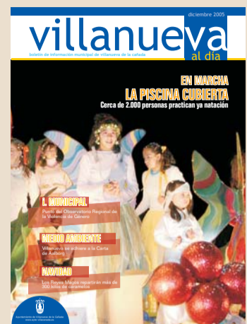
Fotografía: Navidad 2005