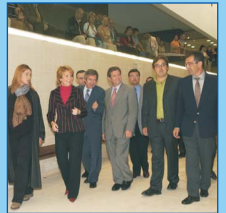
Los arquitectos explicaron a las autoridades el diseño.

El Ayuntamiento ha construido también, ligado al Complejo, una zona de aparcamiento, donde se contemplan plazas para minusválidos.