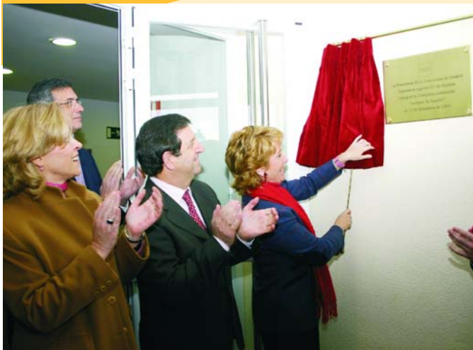
La Presidenta, Esperanza Aguirre, descubrió la placa inaugural.