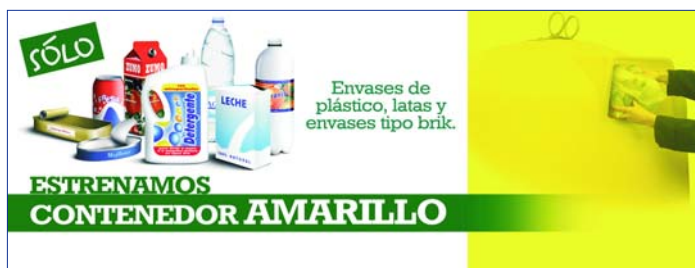
El Ayuntamiento pondrá en marcha también una campaña de concienciación ciudadana.

El objetivo municipal es mejorar la calidad del material que se recoge de los contenedores, con el fin de disminuir los costos de selección y recuperar dicho material para construir nuevos envases. La separación en origen permite reciclar más y mejor, en definitiva, ayuda a proteger el medio ambiente.