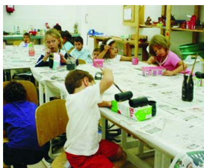
El objetivo, conciliar la vida laboral y familiar.

La Concejalía de Educación oferta el programa "Días Sin Cole" durante las vacaciones escolares de Navidad. Esta iniciativa, en marcha desde el pasado mes de abril con gran éxito de participación durante los días no lectivos en los colegios, tiene como objetivo conciliar la vida laboral y familiar de los padres que trabajan.