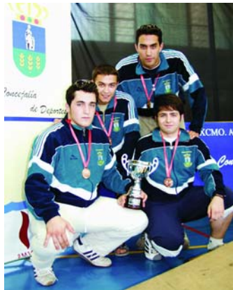
Integrantes del Equipo de Esgrima masculino.

Los interesados en practicar este deporte, pueden informarse sobre las plazas y períodos de matriculación en el Polideportivo Municipal "Santiago Apóstol" (Tel. 91 815 51 80).