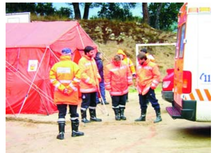
En un simulacro coordinado por el Servicio de Búsqueda y Salvamento del Ejército del Aire.

En la actualidad, la plantilla esta formada por: tres conductores, un enfermero y siete técnicos avanzados en emergencias sanitarias. Son un ejemplo del papel que el voluntariado tiene en nuestra sociedad, siempre al servicio de la ciudadanía.