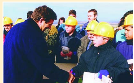
Acto de colocación de la primera piedra en 1998.