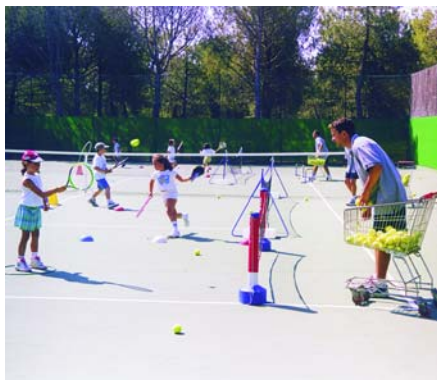
Los torneos se disputarán en el Polideportivo Municipal "Santiago Apóstol".

El próximo 27 de diciembre comenzará a disputarse el "Torneo de Tenis de Navidad" en las categorías alevín e infantil, tanto en masculino como en femenino. Las inscripciones, para todos aquellos que practiquen este deporte y deseen participar, se pueden realizar en el Polideportivo Municipal.