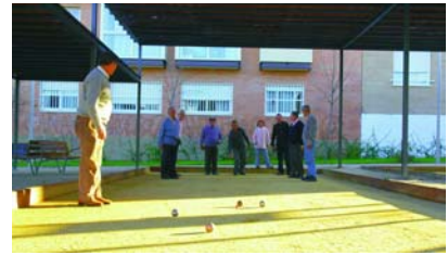
Pistas de petanca en el parque "El Molino".

Con motivo del Día de Reyes, la Concejalía de Mayores ha organizado la tradicional "Fiesta de Reyes". Además de degustar el dulce navideño, los asistentes podrán