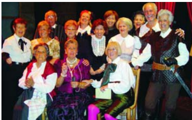
Durante la representación de "Los intereses creados".

"Talía", el grupo de teatro de mayores, continúa cosechando éxitos en Villanueva de la Cañada y también en otros municipios