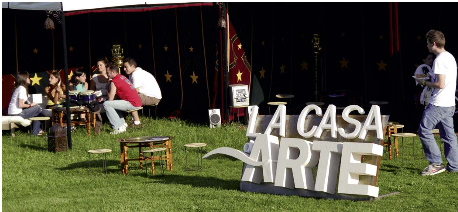
Fomentar la creatividad de los jóvenes es uno de los objetivos del Festival Creadictos.

LOS ESTUDIANTES DE CUARTO CURSO DE LA LICENCIATURA DE PUBLICIDAD Y RELACIONES PÚBLICAS organizan junto con Pícame, la Agencia de Publicidad Junior de la UCJC, la quinta edición de Creadictos'08, iniciativa que cuenta con la colaboración del Ayuntamiento villanovense.