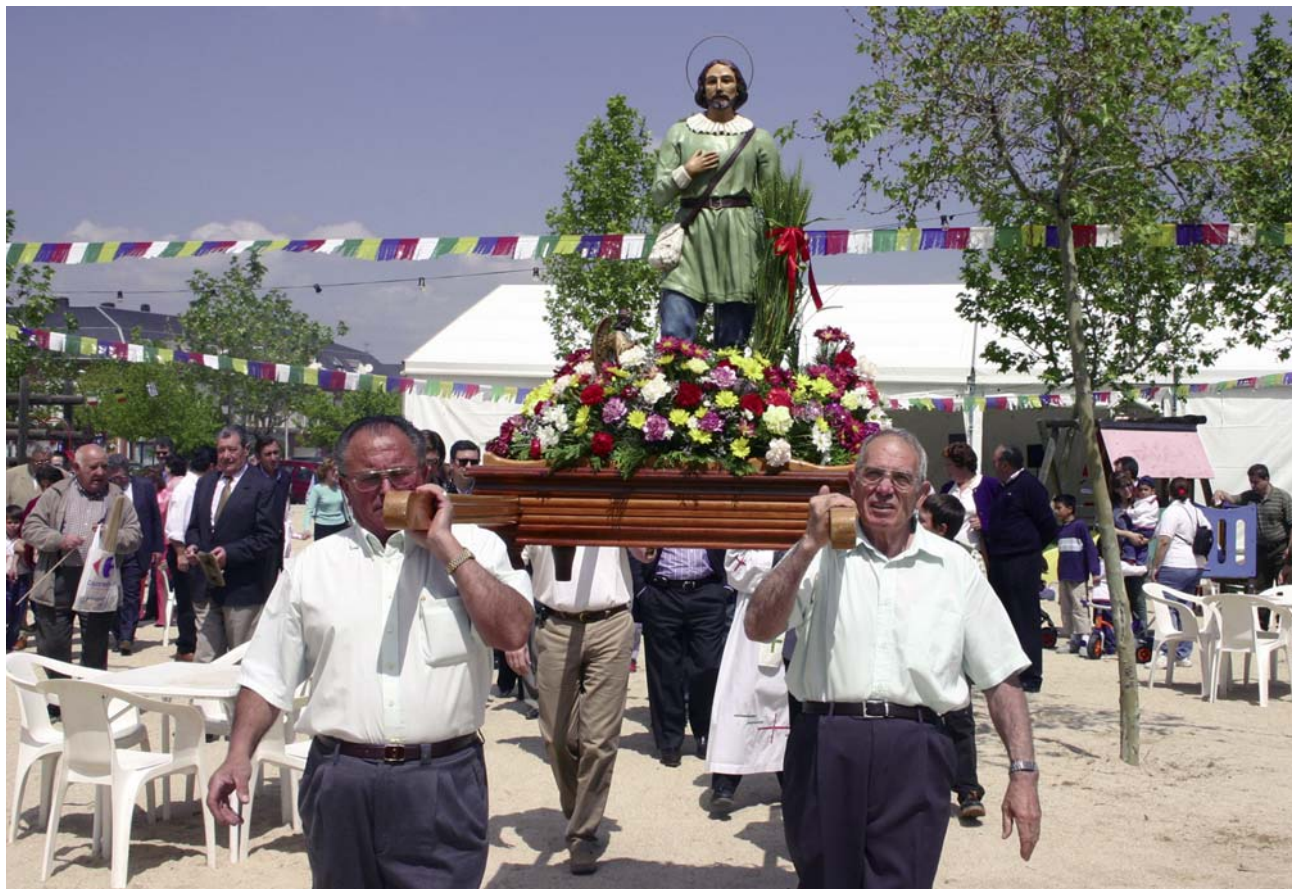
La procesión recorre distintas calles del municipio.

cuanto a los gastos de las actividades que podamos organizar, éstos corren a cargo de los hermanos.