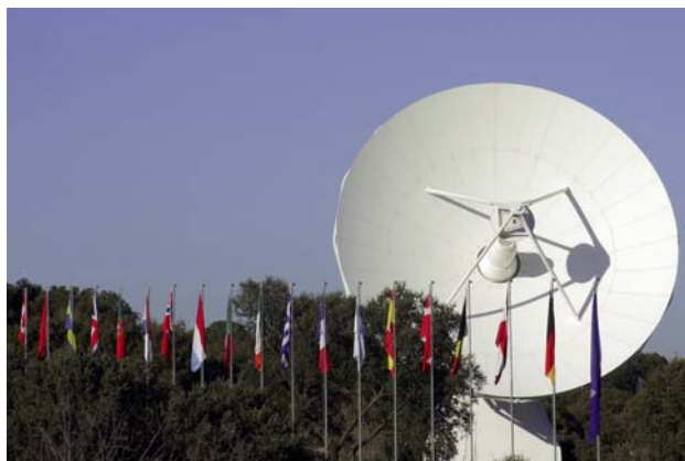
La antena VIL-2 recibió la señal del equipo PCE.

El Centro Europeo de Astronomía Espacial, ESAC, ha desempeñado una tarea esencial en la misión del ATV Julio Verne . Esta cápsula no tripulada debía atracar de forma autónoma en la Estación y, para ello, ambas naves tuvieron que comunicarse . Para hablar con el ATV, la Estación usó, entre otros, un equipo llamado PCE (Equipo de Comunicación de Aproximación). Para demostrar el buen funcionamiento de este equipo –algo vital–, antes del lanzamiento de Julio Verne, se comprobó desde una de las antenas de ESAC que la señal que emitía era efectivamente recibida. La antena que recibió la señal, la VIL- 2, es la misma que da servicio a la misión XMM e Integral, cuyos centros de operaciones científicos están en ESAC.