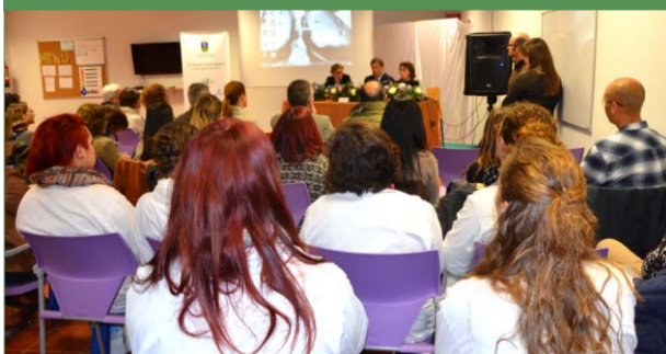
II Jornada Sociosanitaria