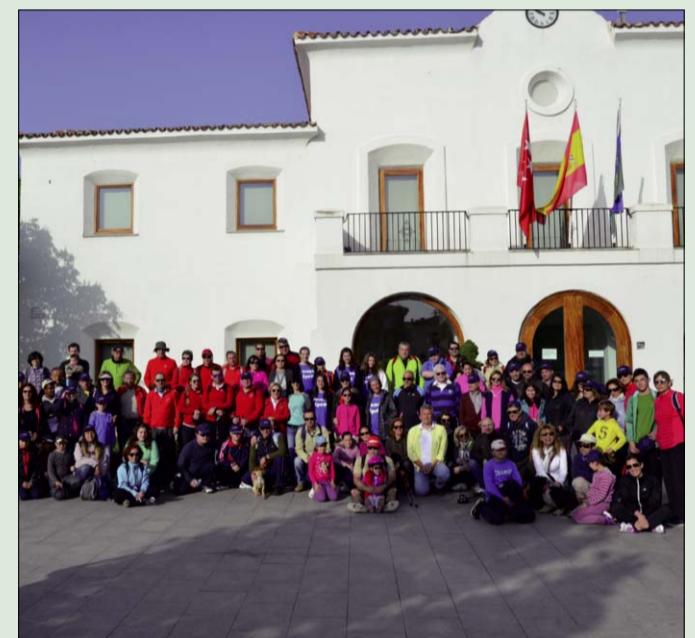
Imagen de los participantes en la Marcha Saludable y Solidaria.

Cerca de un centenar de vecinos de todas las edades participaron en la Marcha Saludable y Solidaria organizada por el Ayuntamiento, a través de la Concejalía de Salud, el pasado 12 de abril. El recorrido, de aproximadamente unos 10 kilómetros (ida y vuelta), comenzó en la plaza de España con destino a los hornos de cal y búnker de la Guerra Civil (Quijorna). En la iniciativa, que puso el broche final a la X Semana de la Salud, colaboraron Puleva, Cobra y el Club de Marcha Nórdica villanovense.