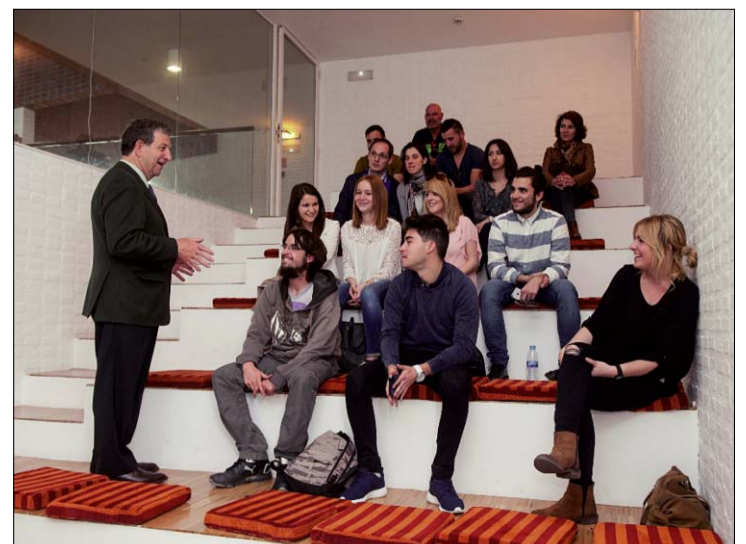
El alcalde conversando con los alumnos

En el acto, también recibieron el certificado un grupo de profesionales de las residencias Amma Villanueva y Sanyres La Cañada por su participación en el Estudio de Características y Necesidades Sociosanitarias de las personas mayores y en el Programa Muévete+.