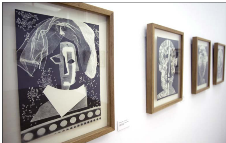
Imagen de algunas de las obras expuestas en la Sala Aulencia.

El resultado es un conjunto de imágenes irreales captadas por la