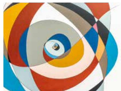
▲ Imágenes de algunas de las obras expuestas en el C.C. La Despernada.