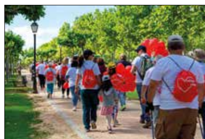
▲ Imágenes de las distintas actividades.

El Ayuntamiento y la Universidad Alfonso X el Sabio organizaron los pasados días 18 y 19 de mayo unas jornadas bajo el lema "Latido a latido. Un corazón sano para toda la vida". Estas tenían como objetivo recordar a la población lo importante que es prevenir las enfermedades cardiovasculares. Las jornadas se enmarcaban dentro de las acciones que viene realizando la Cátedra de Salud Cardiovascular de la