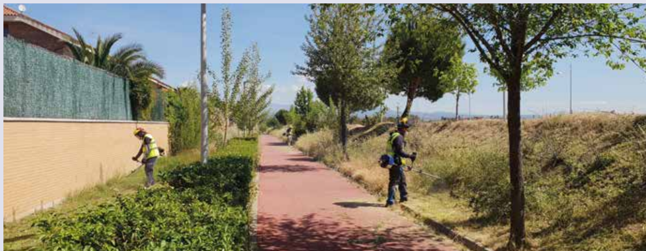
▲ Operarios realizando labores de desbroce en la senda ciclable.

de desechos y residuos. El objetivo de dicha medida es prevenir incendios. A partir de esa fecha, se llevarán a cabo inspecciones municipales. La normativa municipal contempla sanciones de entre 301 y 600 euros para quienes incumplan este deber. El Ayuntamiento pone a disposición de los vecinos contenedores donde pueden depositar los restos vegetales (Servicio de Ventanilla Abierta).