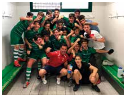
▲ Equipo cadete B.