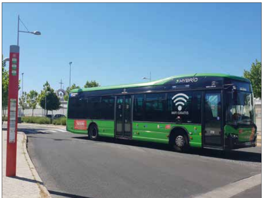
▲ Imagen de un autobús en la avenida de Madrid.

Brunete", que ahora incluye una nueva parada en Villanueva de la Cañada, ubicada en la Ronda de La Raya, 18. Esta parada se suma a las dos existentes en la carretera M-513 en las entradas de las urbanizaciones La Raya del Palancar y Guadamonte.