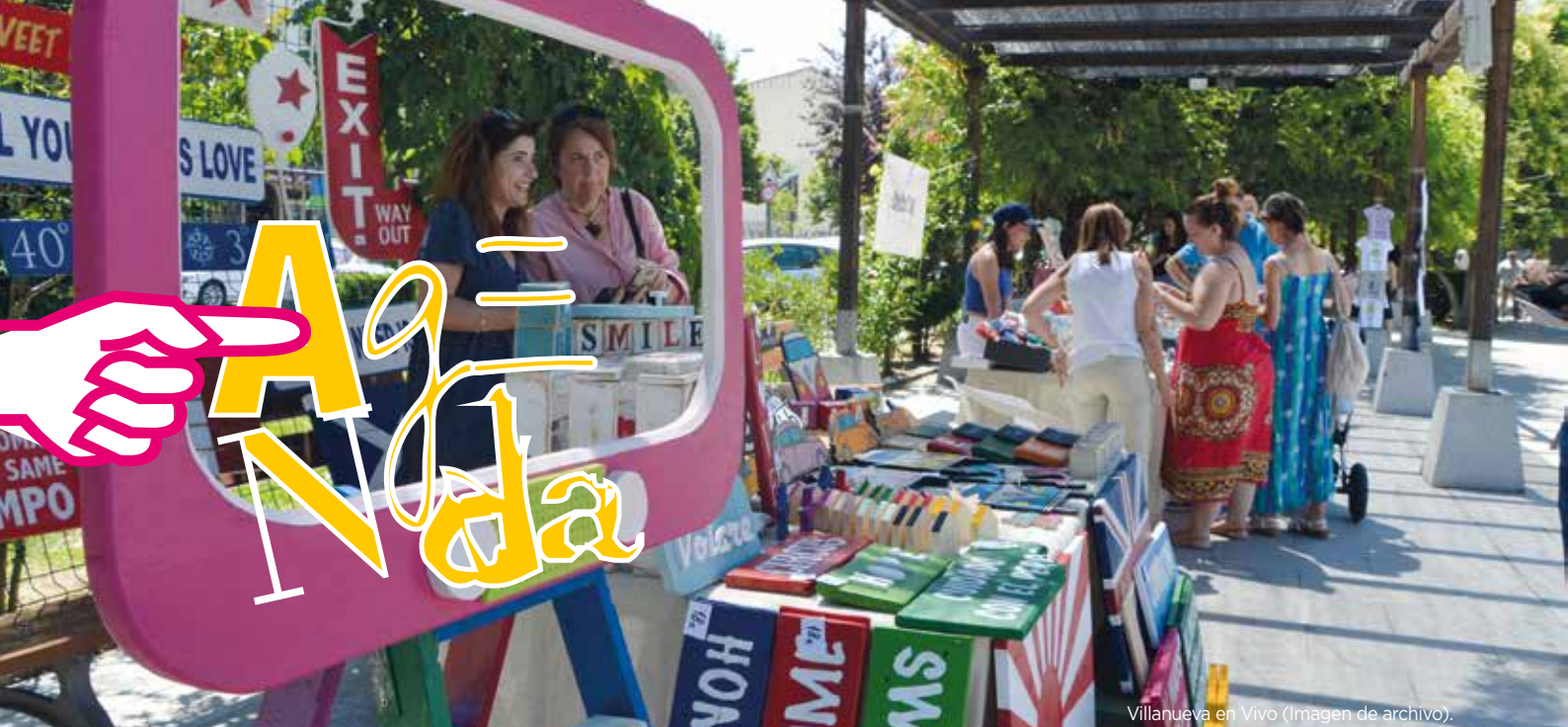
Villanueva en Vivo (Imagen de archivo).