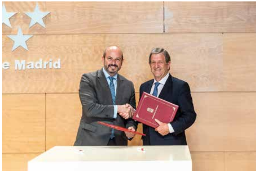
▲ Pedro Rollán y Luis Partida en el acto celebrado en la sede del Gobierno Regional

El regidor villanovense estuvo en el acto, celebrado en la Real Casa de Correos, junto a los alcaldes de Cobeña, El Molar, Loeches, Lozoya, Soto del Real y Villarejo de Salvanés, municipios donde también se van a construir parques de bomberos.