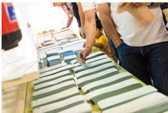
Datos a 30 de mayo de 2019.