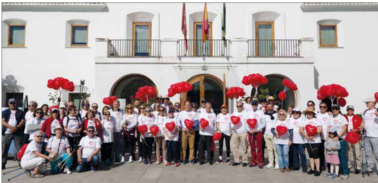
▲ Participantes en la marcha saludable.

En la iniciativa colaboraron el Centro de Salud de Villanueva de la Cañada, la Sociedad Castellana de Cardiología y Late Madrid (Fundación Española del Corazón y de la Fundación Philips), Cruz Roja Sierra Oeste, el Colegio Oficial de Odontólogos y Estomatólogos (COEM) y el Club de Marcha Nórdica del municipio, así como los restaurantes Al Plato María y Asador Panxon.