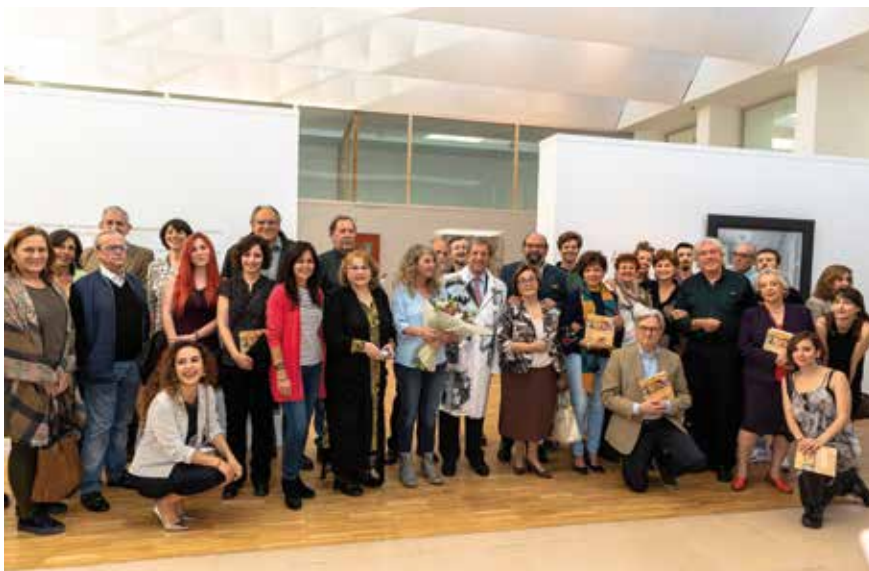
▲ Foto de familia de autoridades y artistas participantes.