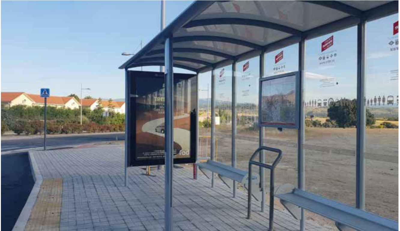
▲ Parada de la L627, situada en la avenida de España, tras los trabajos de remodelación.

Durante el mes de mayo se han llevado a cabo diversas modificaciones relacionadas con las líneas de autobuses que recorren Villanueva de la Cañada. Entre estos cambios se encuentra la remodelación de la parada de autobús de la línea 627 situada en la avenida de España, junto a Aquópolis. Los trabajos han consistido en la creación de una marquesina doble y un carril para que los autobuses puedan realizar la maniobra de parada. Asimismo, se ha ampliado la acera existente para facilitar el acceso a los viajeros. El proyecto ha contado con un presupuesto de más de 36.500 euros.