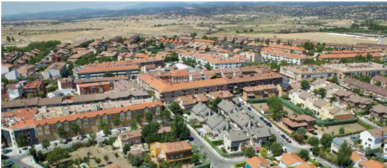
Imagen aérea