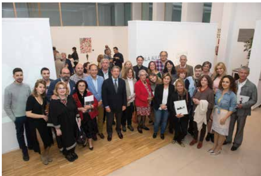
▲ Artistas participantes en la exposición junto a miembros de la Corporación Municipal a la entrada de la Sala Aulencia.

El acto inaugural, amenizado por el cuarteto de Clarinetes de la Escuela Municipal de Música y Danza, congregó a numerosos vecinos y representantes del mundo de la cultura a nivel local. La exposición se puede visitar hasta el 3 de junio de lunes a viernes, de 9:00 a 21:00 h. y los sábados, de 10:00 a 14:00 h. La entrada es gratuita.