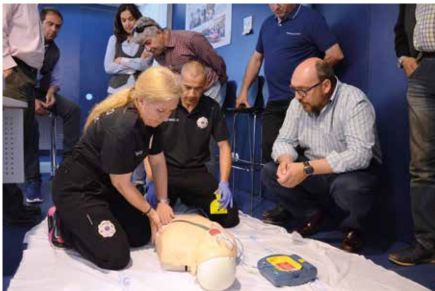
▲ Imagen de uno de los cursos impartidos por técnicos del Servicio Municipal de Transporte Sanitario Urgente para empleados del Ayuntamiento.

El consistorio organiza cursos, de primeros auxilios y RCP Básica, para la población en general, docentes de