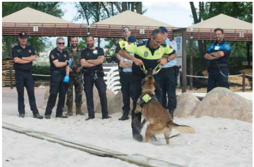
▲ Imágenes de la primera jornada del "I Campus de Trabajo con Perro Detector de Estupefacientes".

Durante la última jornada, el 2 de junio, tendrá lugar una exhibición de las unidades caninas participantes. Será a partir de las 10:00 h. en el Campo de Fútbol Municipal y estará abierta a escolares así como al público en general.