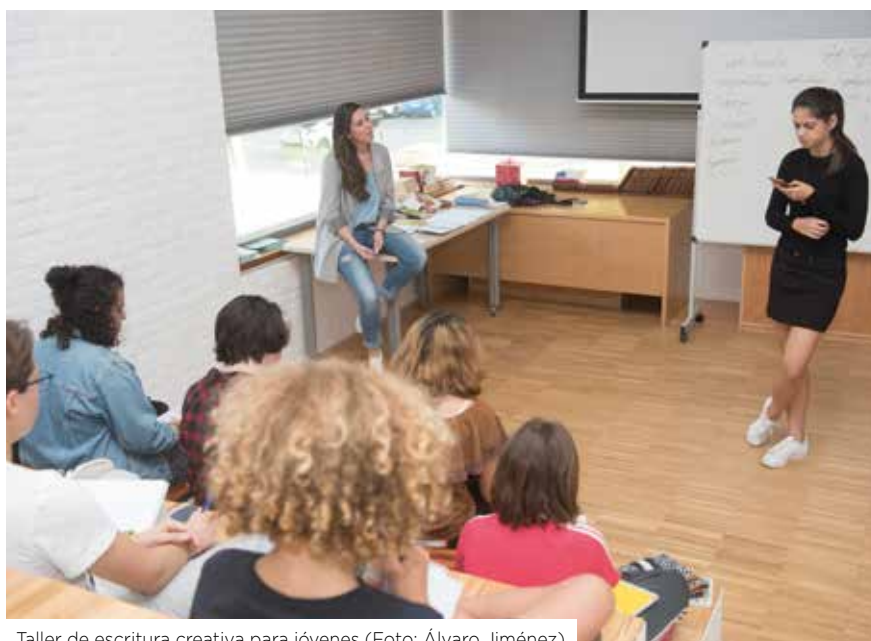
Taller de escritura creativa para jóvenes

un 71,4%, once puntos más que la media nacional, según el Barómetro de Hábitos de Lectura y Compra de