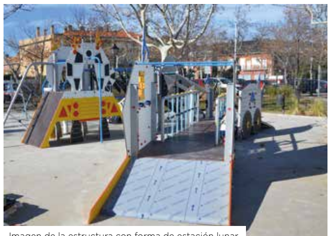
Imagen de la estructura con forma de estación lunar.

Por otro lado, el consistorio tiene previsto renovar otros parques a lo largo de 2018. En la actualidad, Villanueva de la Cañada cuenta con cerca de una treintena de parques infantiles.