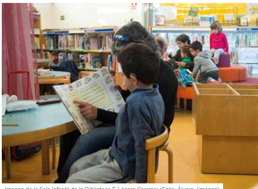
Imagen de la Sala Infantil de la Biblioteca F. Lázaro Carreter

Por otro lado, las cifras sobre el número de préstamo por habitante y número de ejemplares por habitante en Villanueva de la Cañada están en sintonía con la media global de la Comunidad de Madrid. Esta es, por otro lado, la comunidad autónoma con mayor índice de lectores, con