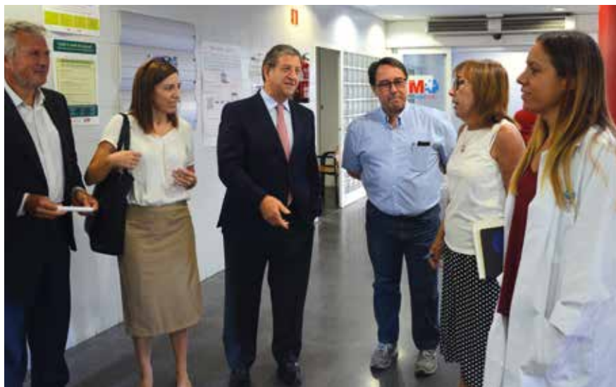
▲ Autoridades municipales junto a responsables del centro y de las obras.

una duración estimada de 18 meses. Su coste, superior a los dos millones seiscientos mil euros, correrá a cargo de la Consejería de Sanidad de la Comunidad de Madrid.