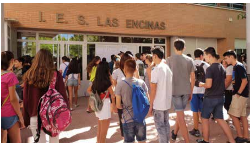
▲ Inicio del curso en el Instituto de Educación Secundaria Las Encinas.

Un total de 7.083 alumnos, con edades comprendidas entre los 0 y 18 años, se han matriculado en los centros educativos públicos, concertados y privados de Villanueva de la Cañada para el Curso 2018/2019 (Educación Infantil, Primaria, ESO, Bachillerato y FP). La cifra supera en algo más de un millar la del pasado curso. Todas las solicitudes presentadas, tanto en el periodo ordinario como en el extraordinario, han sido atendidas.