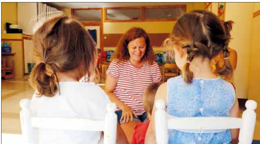
▲ Imagen de la Escuela Infantil Municipal Los Cedros.

El número de estudiantes matriculados ha aumentado en más de un millar con respecto al pasado curso