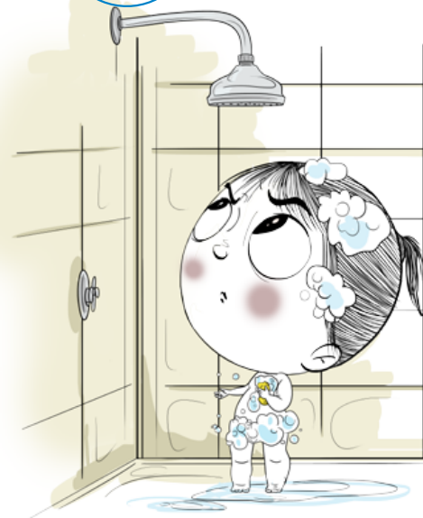
▲ Imágenes de la campaña "Súmate al reto del agua".

Ducharse en lugar de bañarse: AHORRO DE 150 litros POR DUCHA