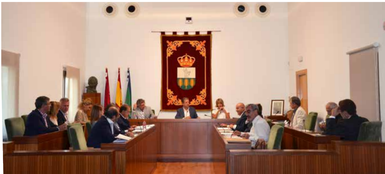
▲ Imagen de la sesión plenaria celebrada el pasado 14 de septiembre

La empresa CESPA será la encargada de la gestión durante los próximos cuatro años