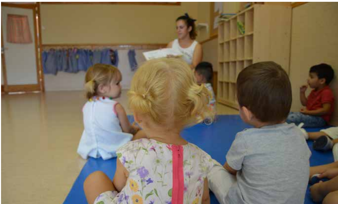
▲ Imagen de una profesora junto a sus alumnos en la Escuela Infantil Municipal Los Cedros.

El pasado mes de septiembre arrancó el nuevo curso para cerca de 6.000 alumnos (de 0 a 18 años) en los centros educativos públicos, concertados y privados del municipio. Como en años anteriores, durante el curso académico, el Ayuntamiento llevará a cabo distintas iniciativas destinadas a la población escolar: Programa de Educación Vial, Campaña de Visitas Escolares a la Biblioteca Municipal, Programa de Prevención de la Obesidad Infantil, Programa 3E, etc.