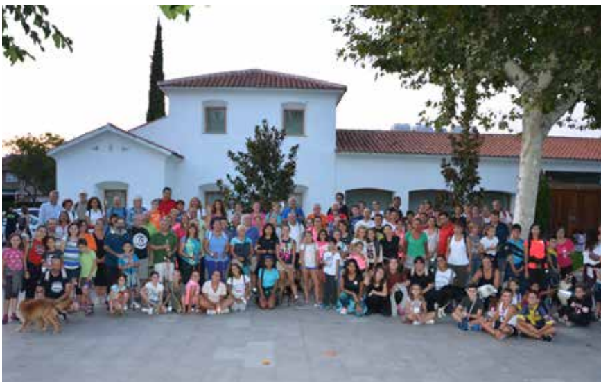
▲ Participantes en la Marcha Saludable Nocturna, en la plaza de España, antes de iniciar el recorrido.

Continúa, por otra parte, vigente el servicio de clínicas odontológicas de guardia los fines de semana y días festivos en el municipio. El calendario con las clínicas de guardia está a disposición de los vecinos en la página web del Ayuntamiento ( www.ayto-villacanada.es ).