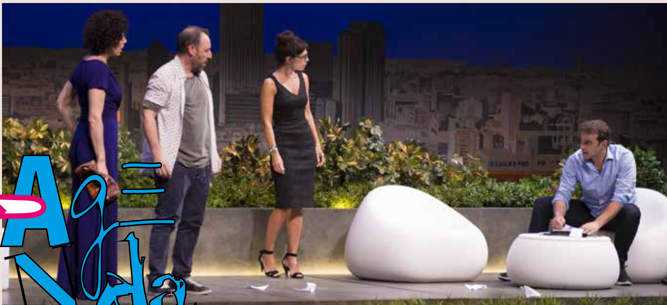
Escena de la obra "El Test" (www.distribuciongirras.com)