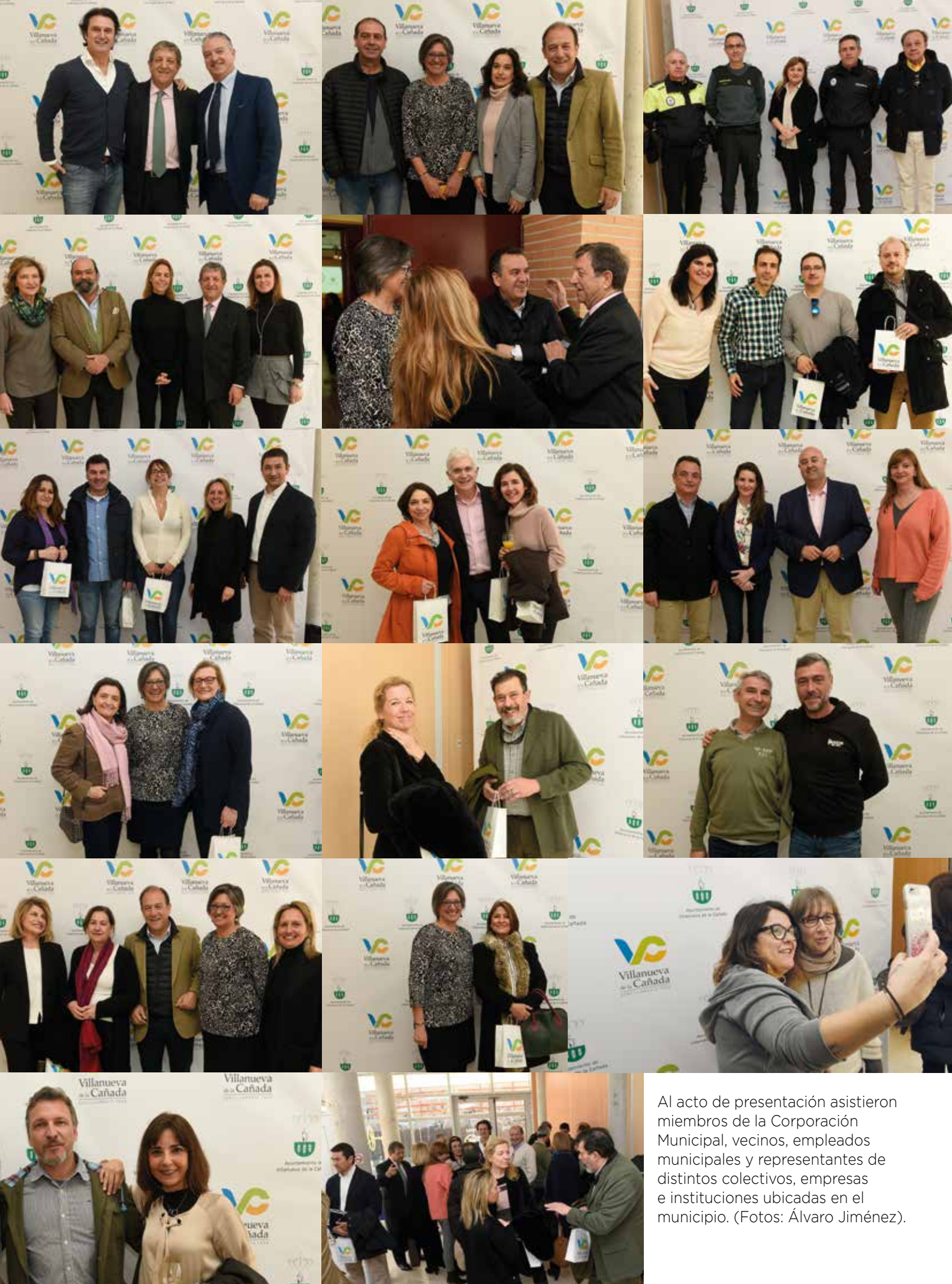
Al acto de presentación asistieron miembros de la Corporación Municipal, vecinos, empleados municipales y representantes de distintos colectivos, empresas e instituciones ubicadas en el municipio.