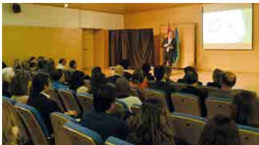
▲ Imagen del acto de presentación de la Marca Territorio.