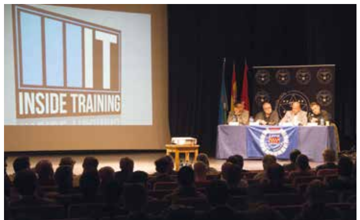
▲ Imagen del seminario celebrado en el C.C. La Despernada.