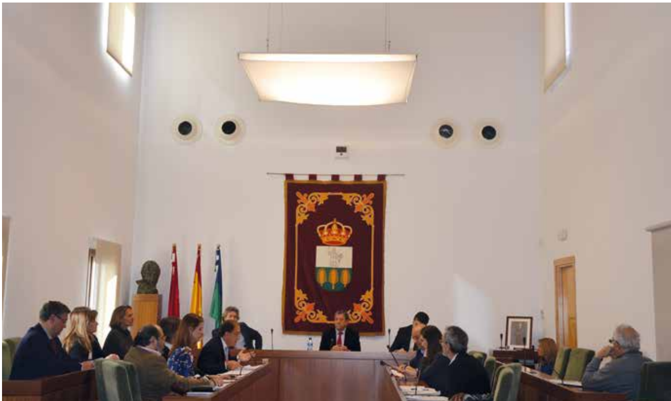
Imagen del pleno extraordinario celebrado el 20 de marzo de 2018.

Las cuentas, presentadas por el Gobierno Municipal, ascienden a 21.400.000 euros.