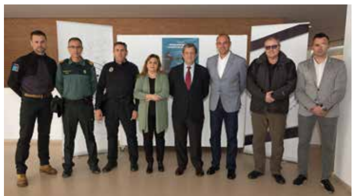
▲ Autoridades junto a los ponentes del seminario.