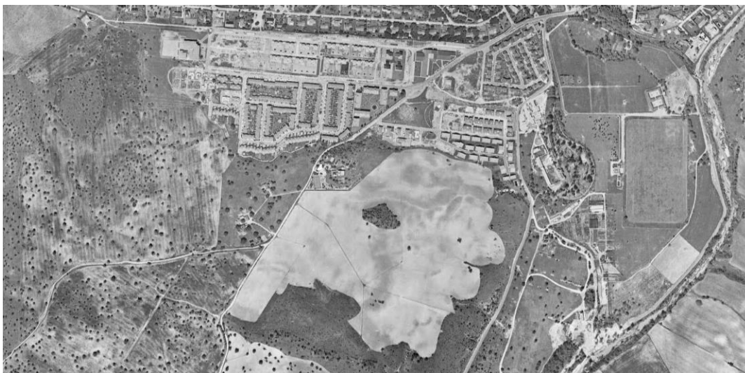
Fotografía aérea de 1991

Por otra parte, en el año 1999, puede verse el abandono de las labores agrícolas en esa zona.