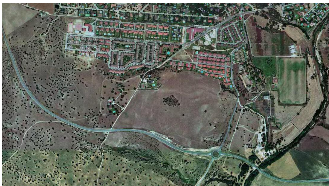
Fotografía aérea de 1999

Por otra parte, en el año 1999, puede verse el abandono de las labores agrícolas en esa zona.