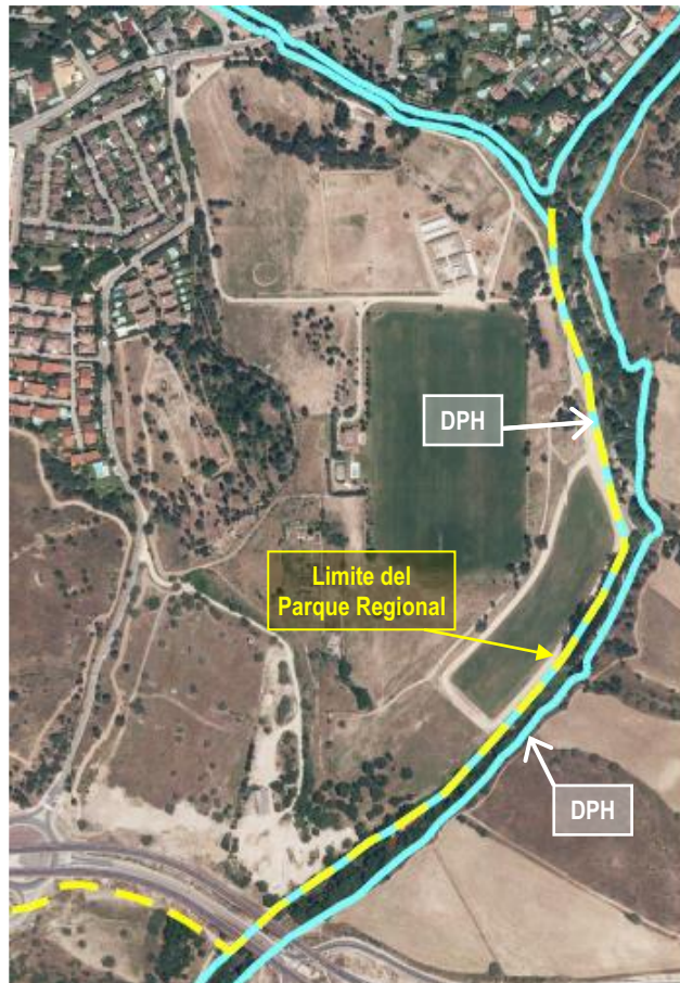
Figura 18: Zona de gravera junto al limite del Parque Regional

especial interés natural, tal como se muestra en la figura 18 adjunta, donde se representa en azul el Dominio Público Hidráulico (DPH) y el límite del Parque Regional con una línea discontinua amarilla, que en la margen derecha del río coincide con el DPH.