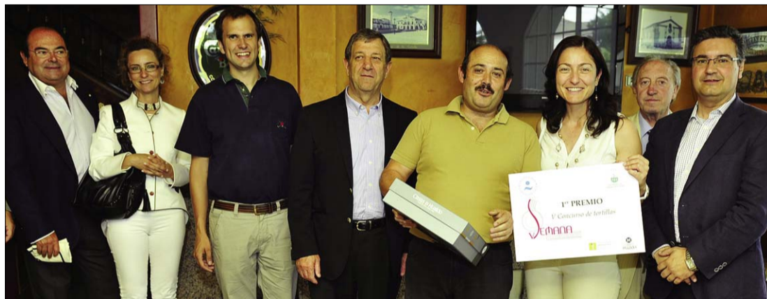
El "Gran Chaparral" ganó el Concurso de Tortillas para hosteleros

Un estudio refleja el aumento del número de personas con formación universitaria en este sector