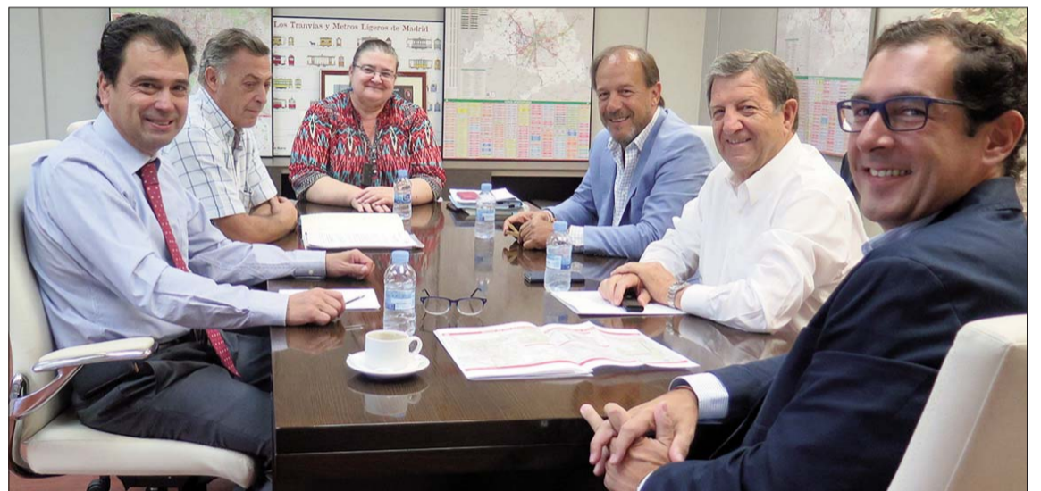
Imagen de la reunión celebrada en el Consorcio Regional de Transportes el pasado mes de septiembre donde se acordó la puesta en marcha del servicio exprés.

Los nuevos horarios de la línea 627 así como cualquier información sobre el transporte público en Villanueva de la Cañada, está disponible en la página web www.crtm.es y en la App "Mi transporte", con información en tiempo real de todos los modos de transporte de la Comunidad de Madrid.