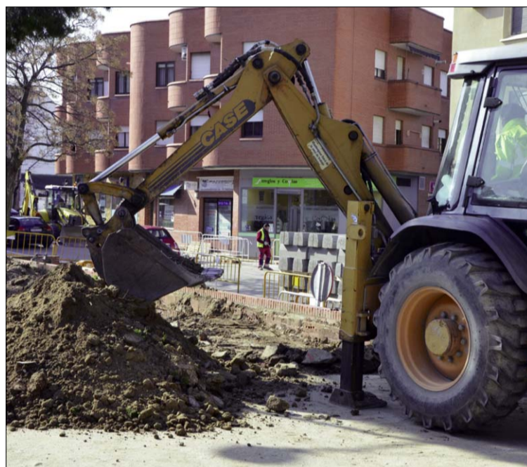
Imagen de las obras

Además se van a peatonalizar dos tramos de las calles Travesía de