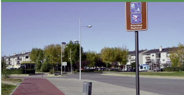
Desde el centro urbano a La Raya del Palancar