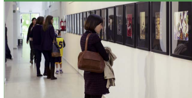
La Despernada abre sus puertas a los creadores