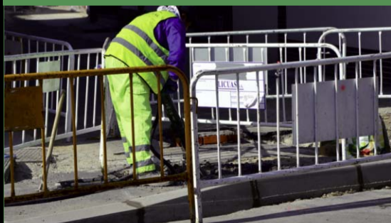
Remodelación de la plaza de La Tejera