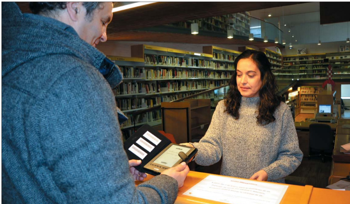
Un usuario solicitando el préstamo de un libro electrónico en la biblioteca

Con el fin de fomentar el hábito lector, también a través de las nuevas tecnologías, la Concejalía de Cultura pone en marcha en la Biblioteca Municipal F. Lázaro Carreter un nuevo servicio. A partir de ahora, sus usuarios tendrán la oportunidad de llevarse a casa prestado un libro electrónico en el que podrán leer hasta quince títulos de distintos autores y temáticas, entre otros, "El cielo ha vuelto" de Clara Sánchez, "Doctor sueño" de Stephen King, "No confíes en Peter Pan" de John Verdon, "Una verdad delicada" de John Le Carre o "Las olas del destino" de Sarah Lark.