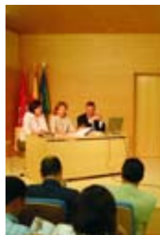
Acto de presentación de resultados el pasado 27 de mayo.

Precisamente, la Concejalía acaba de editar- con la colaboración de la Fundación Española de la Nutrición y de la Comunidad de Madrid- el libro, titulado: "Alimentación en Escolares". A través de diez capítulos, expertos en nutrición abordan las condiciones básicas que, en cuanto al equilibrio nutricional, deben cumplir los menús en los comedores de los centros docentes.