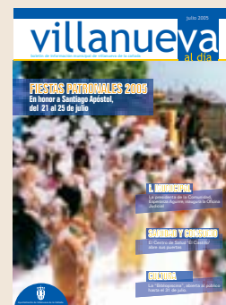
Fotografía: Fiesta de la espuma