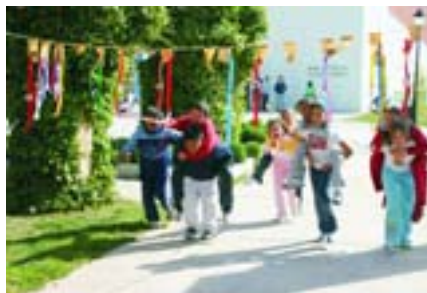
Acercar "El Quijote" a los niños, objetivo de la gincana.

Las actividades sobre la obra y vida del escritor, las visitas a su casa en Alcalá de Henares, la lectura de los capítulos de "El Quijote" o las representaciones teatrales sobre las aventuras descritas por Cervantes han tenido también un papel destacado en las programaciones de todos los