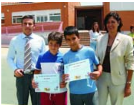
Los concejales de Seguridad y Educación durante la entrega de diplomas.

El programa cuenta con una parte teórica (charlas, vídeos y diapositivas sobre la señalización vial, la figura del peatón, etc) y otra práctica. Esta última contempla: clases en el circuito de karts de la Dirección General de Tráfico, paseos en bicicleta y excursiones por la vía pública. Una