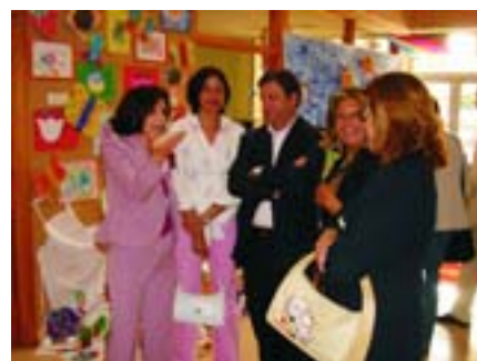
El alcalde inauguró la muestra.

"Por amor al arte" es el título del proyecto de formación, promovido por la Escuela Infantil Municipal "Los Cedros" con el apoyo del Ayuntamiento y la Consejería de Educación de la Comunidad de Madrid. Un proyecto, en torno a la expresión artística y la pintura como vehículo de transmisión del aprendizaje. Éste culminaba con una exposición, que desde finales de mayo y hasta principios de junio, convirtió a la escuela en una auténtica galería de arte.