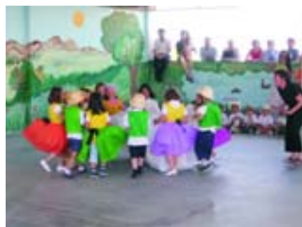
Alumnos del C.E.I.P "María Moliner".

centros educativos del municipio. Profesores, padres y alumnos han participado en este homenaje tan particular.