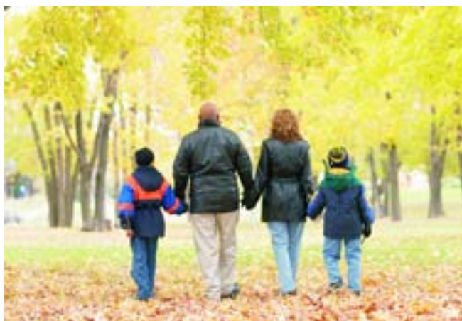
Los ciudadanos, principales beneficiarios.

La Comunidad dotará la oficina de infraestructuras, material y aplicaciones informáticas y formará al personal del Ayuntamiento. En el acto, celebrado en el Palacio del Infante Don Luis (Boadilla del Monte), participaron también los regidores de Boadilla del Monte, Valdemorillo, Navalcarnero y El Escorial, municipios que también dispondrán de una Oficina de Atención al Ciudadano.