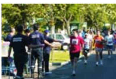
Policía Local, G. Civil y Protección Civil velaron por el buen desarrollo de la carrera.