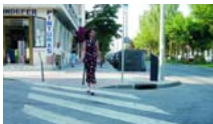
Estas actuaciones municipales van dirigidas a conseguir la plena integración social de las personas con minusvalía.