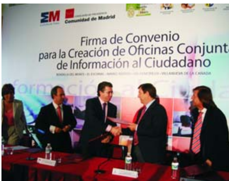
El alcalde y el consejero rubricaron el acuerdo.