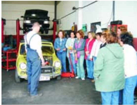
El curso se desarrolló en Talleres Delta.

Se trata de una iniciativa, enmarcada dentro del "Plan Municipal de Igualdad entre hombres y mujeres". En ese sentido, la Concejalía organizó -en colaboración con la Asociación de Mujeres (AMVAR)- un "Taller de mecánica básica" el pasado mes de mayo con gran éxito de participación. Las clases, impartidas por un mecánico del municipio,