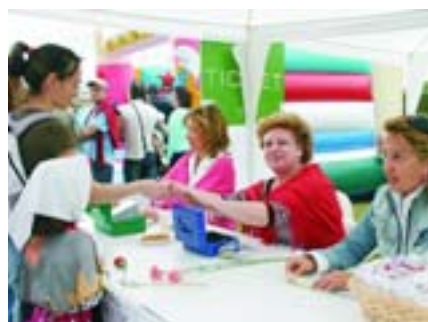
Los miembros de la Corporación participaron también de forma muy activa.

El agradecimiento municipal se hace extensible a todos aquellos vecinos que llevaron, para su venta, distintos platos de comida casera o se encargaron de la bebida, entre ellos, los miembros de las peñas Las Katas y Los Cucos, la Asociación de Mayores y la Asociación de Mujeres AMVAR que acudieron hasta el Parque de la Ermita del Angel para aportar su granito de arena.