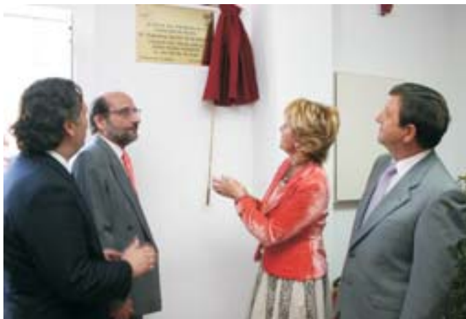
La presidenta de la Comunidad descubrió la placa inaugural.