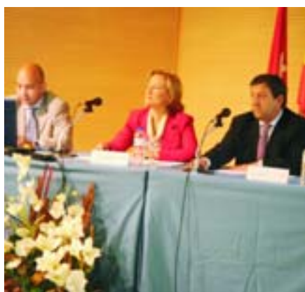
El regidor destacó la importancia del estudio para los ayuntamientos.