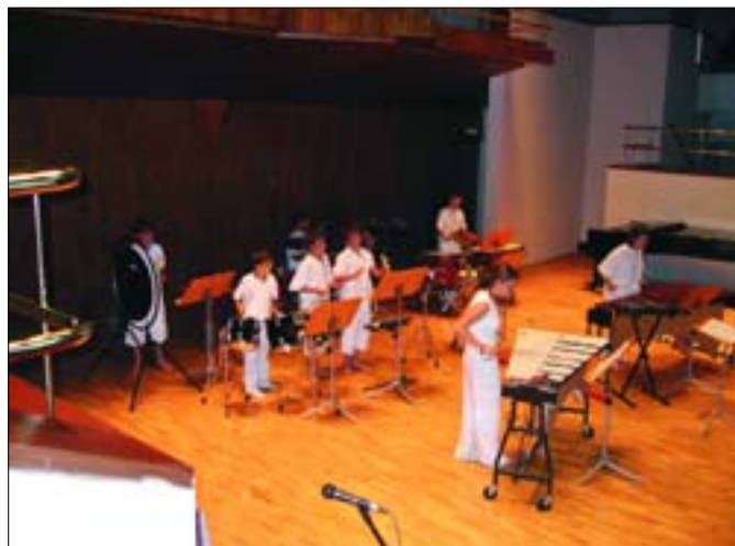
Actuación en el Auditorio Nacional.

La EMMD hace un especial esfuerzo por fomentar las agrupaciones musicales y así a lo largo de estos años se ha formado: el Coro, la Orquesta de Música Antigua y recientemente, la Banda.