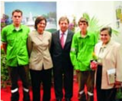
El alcalde y la concejal de Educación en el expositor de Villanueva.

Formar y conseguir la inserción laboral de aquellos jóvenes que, por distintas circunstancias, no consiguen superar la Educación Secundaria Obligatoria es el objetivo del Programa de Garantía Social, en la modalidad de Formación y Empleo. Una iniciativa, impulsada por la Federación de Municipios de Madrid (FMM), a la que está adherida Villanueva de la Cañada desde hace casi una década.