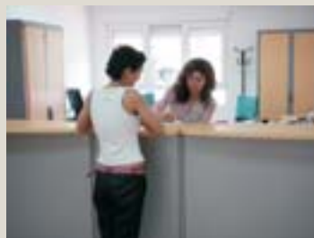
Presta una atención especializada a víctimas de violencia de género.

La orientación jurídica, la atención psicosocial y la atención a las víctimas de todo tipo de delitos, especialmente a aquellas que sufren malos tratos, son los principales servicios que presta. En la oficina trabajan: un psicólogo, un médico forense, un trabajador social y un responsable de gestión para la tramitación, registro e información al ciudadano. De modo que, ante casos de violencia de género, las víctimas pueden ser examinadas en la oficina, que contará además con un coordinador, encargado de gestionar todo lo relativo a las órdenes judiciales de protección.