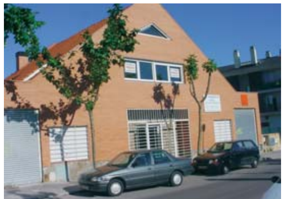
La Oficina Técnica Municipal trabaja en su rediseño.

Su puesta en marcha evitará a los ciudadanos de Villanueva de la Cañada y de los municipios limítrofes trasladarse hasta Móstoles para solucionar cuestiones judiciales. Recibirán asesoramiento jurídico gratis y podrán tramitar todos aquellos asuntos que estén relacionados con la Administración de Justicia. El edificio