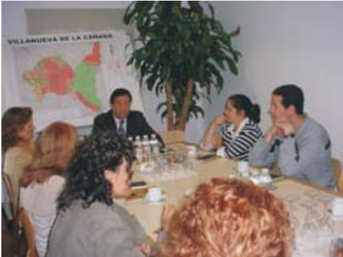
El regidor intercambia opiniones con los asistentes.