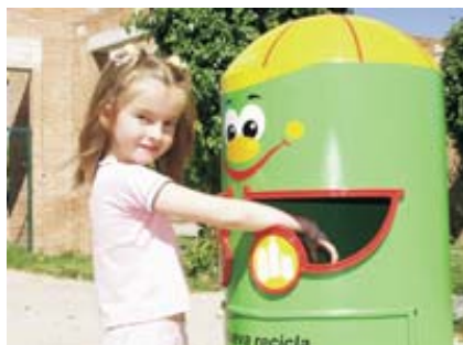
Con las nuevas papeleras, los niños aprenden a reciclar.

La inauguración de la senda se enmarca dentro de las actividades organizadas con motivo de la denominada "Semana del Medio Ambiente", en la que han participado más de un millar de personas -la mayoría niños y adolescentes- a lo largo del mes de mayo y durante la primera quincena de junio.