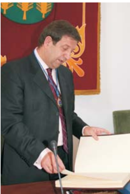
El Alcalde tras recibir el libro de dedicatorias.

Con motivo de la celebración del XXV Aniversario de las primeras Elecciones Municipales de la Democracia y la toma de posesión de las primeras Corporaciones Municipales democráticas, en 1979, el Ayuntamiento de Villanueva de la Cañada rindió homenaje, el pasado 1 de mayo, a los concejales de las siete Corporaciones Municipales, elegidas y presididas desde entonces por el Alcalde, Luis Partida, quien, por sorpresa, recibió durante el acto un homenaje de todos los ediles. Un concierto lírico, a cargo del joven tenor Julio Cendal, puso el broche de oro a la jornada conmemorativa.