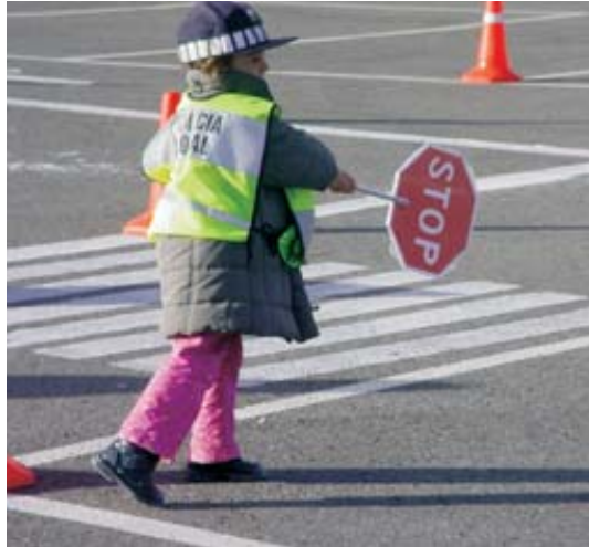
Los niños desempeñan el papel de agentes de tráfico durante la clase.

El objetivo fundamental es fomentar entre los escolares una conciencia vial que les permita como peatón, viajero y conductor de bicicletas- prevenir accidentes relacionados con el tráfico. Una conciencia en la que -señalan los responsables municipales- juegan un papel muy importante los padres y educadores.