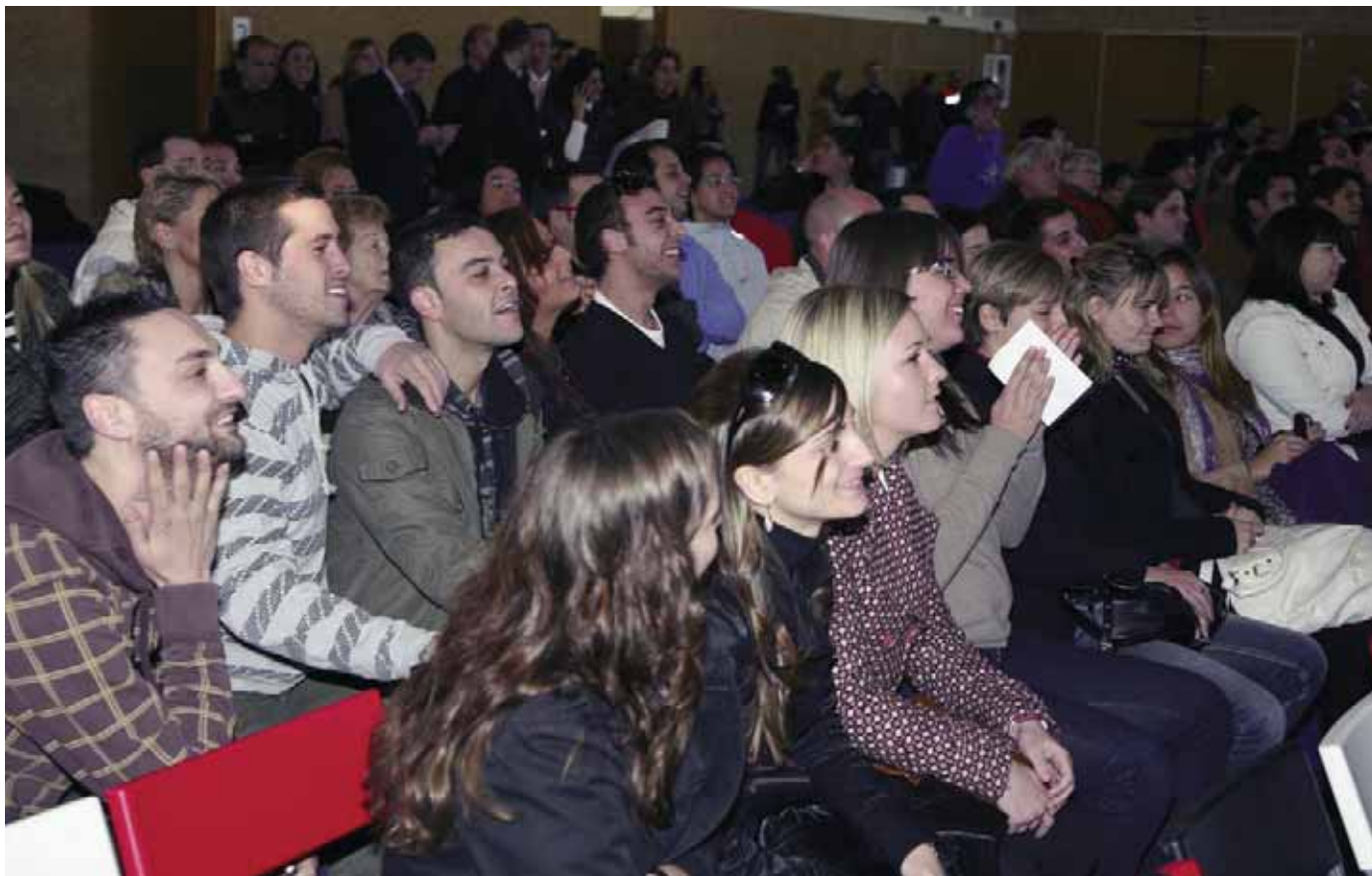
Cientos de vecinos, la mayoría jóvenes, vivieron en directo el sorteo.