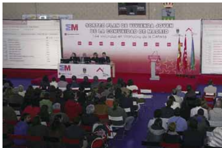
El sorteo se realizó ante notario.

El ahorro energético y la apuesta por las energías renovables son dos de las principales características del proyecto. De hecho, se realizó un estudio del soleamiento de las fachadas con el fin de reducir el consumo de calefacción en invierno y de aire acondicionado en verano. Las viviendas tienen contraventanas deslizantes de chapa perforada, que protegen del sol el interior de la vivienda. El diseño de las ventanas también permite regular o filtrar diversos sistemas de refrigeración y ventilación natural. Por otro lado, la creación de un patio interior, común al corredor de acceso a las viviendas, facilita la ventilación cruzada en el interior de las casas.