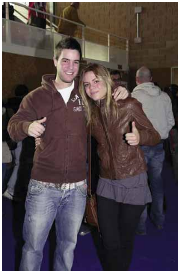
Dos de los jóvenes afortunados que resultaron agraciados en el sorteo con una vivienda.