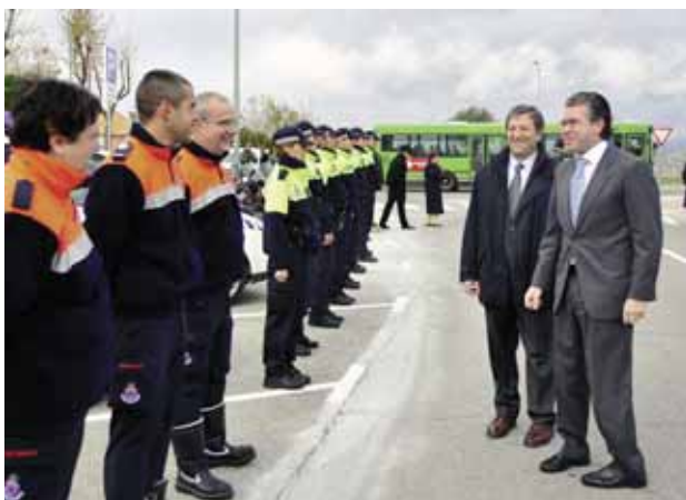
El consejero pasó revista antes de la inauguración.

Como el resto de los centros municipales, se caracteriza por la horizontalidad y las grandes cristaleras que iluminan su interior, organizado de forma concéntrica. El color y la transparencia son dos de los elementos de diferenciación entre estancias, mientras que el hormigón unifica la propuesta. Otro de los elementos destacados del diseño es el hito vertical, ligero y translúcido, que alberga la torre de telecomunicaciones.