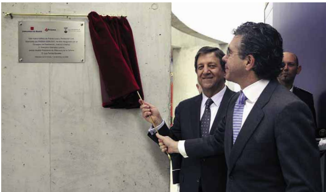
El consejero y el alcalde descubrieron la placa inaugural.

LA NUEVA SEDE ACOGE TAMBIÉN A LOS EFECTIVOS DE LA AGRUPACIÓN DE PROTECCIÓN CIVIL