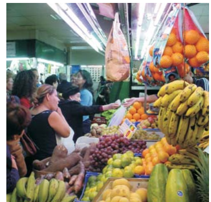
El objetivo, conseguir la integración del colectivo inmigrante.

Esta actuación tiene como fin ser un instrumento más al servicio de la integración de este colectivo que representa aproximadamente un 16% de los habitantes del municipio. Habitualmente, estos vecinos presentan un perfil alimentario muy distinto ya sea por factores geográficos, culturales o religiosos. La alimentación es además uno de los aspectos que más se altera tras el proceso migratorio.