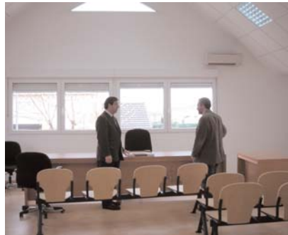
El Alcalde, supervisando las obras del inmueble.

encargado de las obras de remodelación y aparcamiento. Desde la Oficina Técnica Municipal se ultiman durante estos días los trabajos. El nuevo edificio, ubicado en la avenida Gaudí esquina calle del Cristo, albergará también las dependencias del Juzgado de Paz.