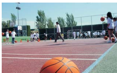
Los objetivos, practicar deporte y disfrutar de un tiempo de ocio saludable.

de la Actividad Física y el Deporte de la UAX participaran también en la ya tradicional cita deportiva como monitores.