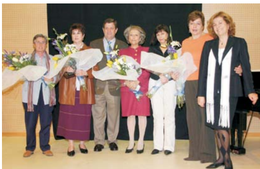
El Alcalde y la Concejal de Mujer, junto a las premiadas.