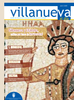
Fotografía: Mosaico de Mádaba