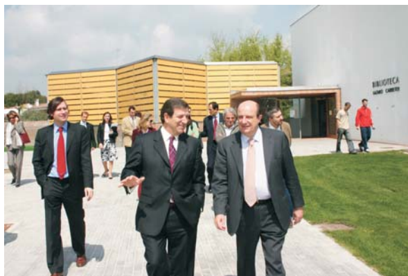
El Consejero destacó la calidad arquitectónica de las instalaciones culturales y deportivas.