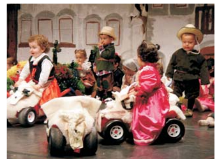
"Donquijotepuntocom" se ganó la ovación del público.

La escuela se encargó del diseño y construcción del decorado. En la confección del vestuario cervantino y la recreación de las hogazas de pan, colaboraron diferentes comerciantes del municipio.